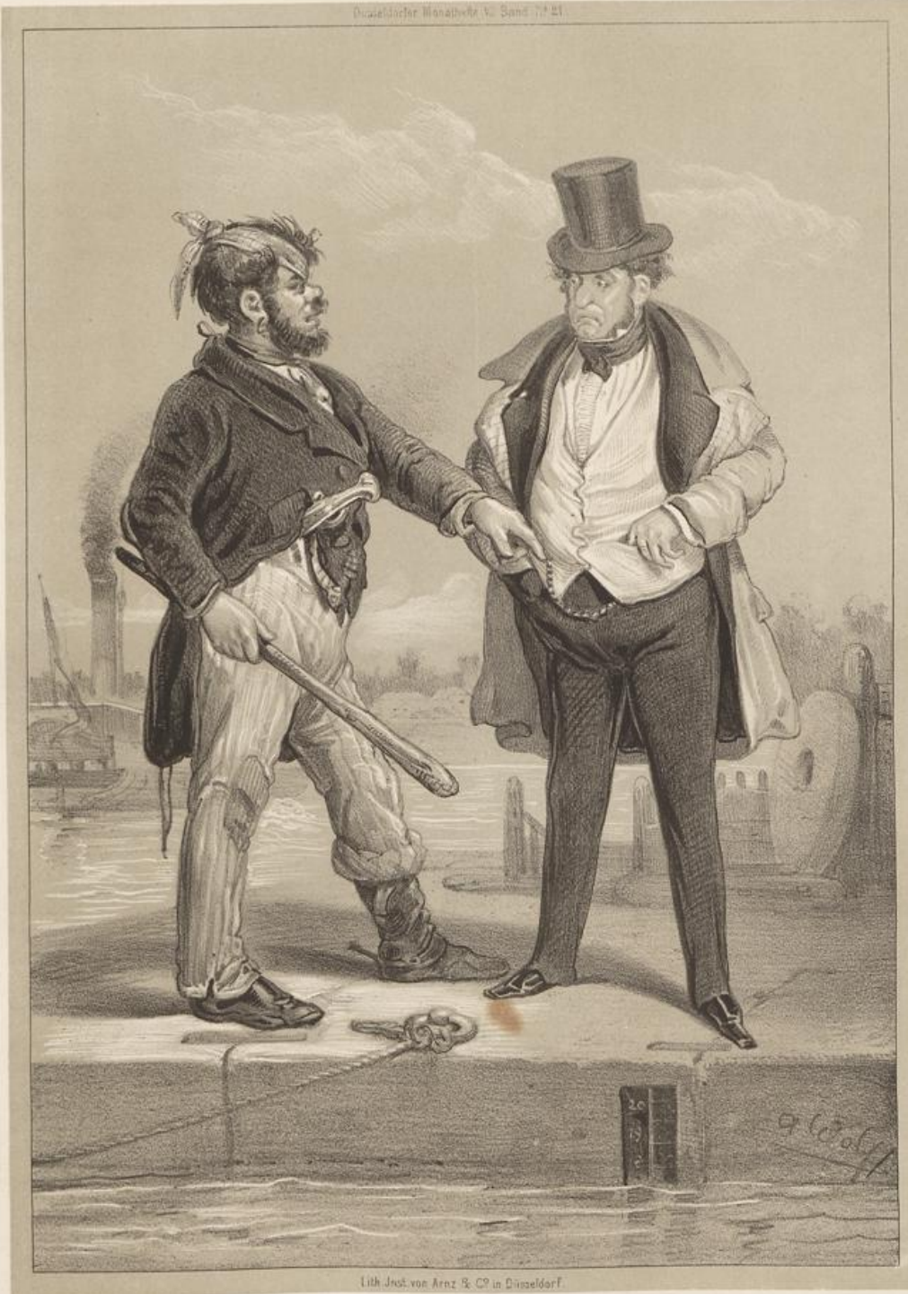
Lith. Just. von Arndt & Co. in Düsseldorf.

Jeehrter Herr! Jck brauche nothjedrungen heute noch zehn Thaler oder die Rettungs-Medaille! Rücken Sie 'raus oder springen Sie jefälligst 'rein, damit ick Jhnen retten kann!! Haben Sie die Jewoßenheit!!