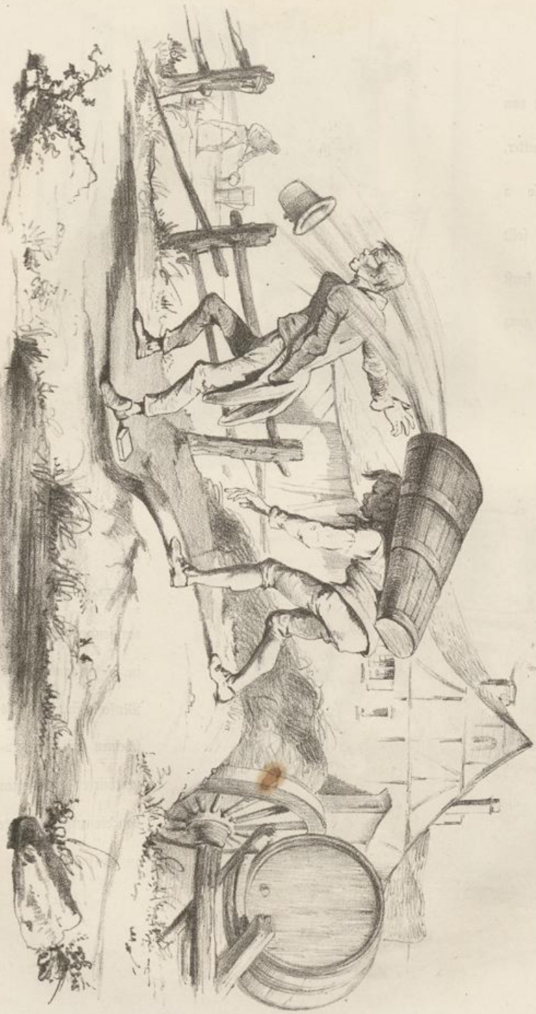
Herr Schulmeister, Ihr habt d' Cuhahsdofe verlorren!