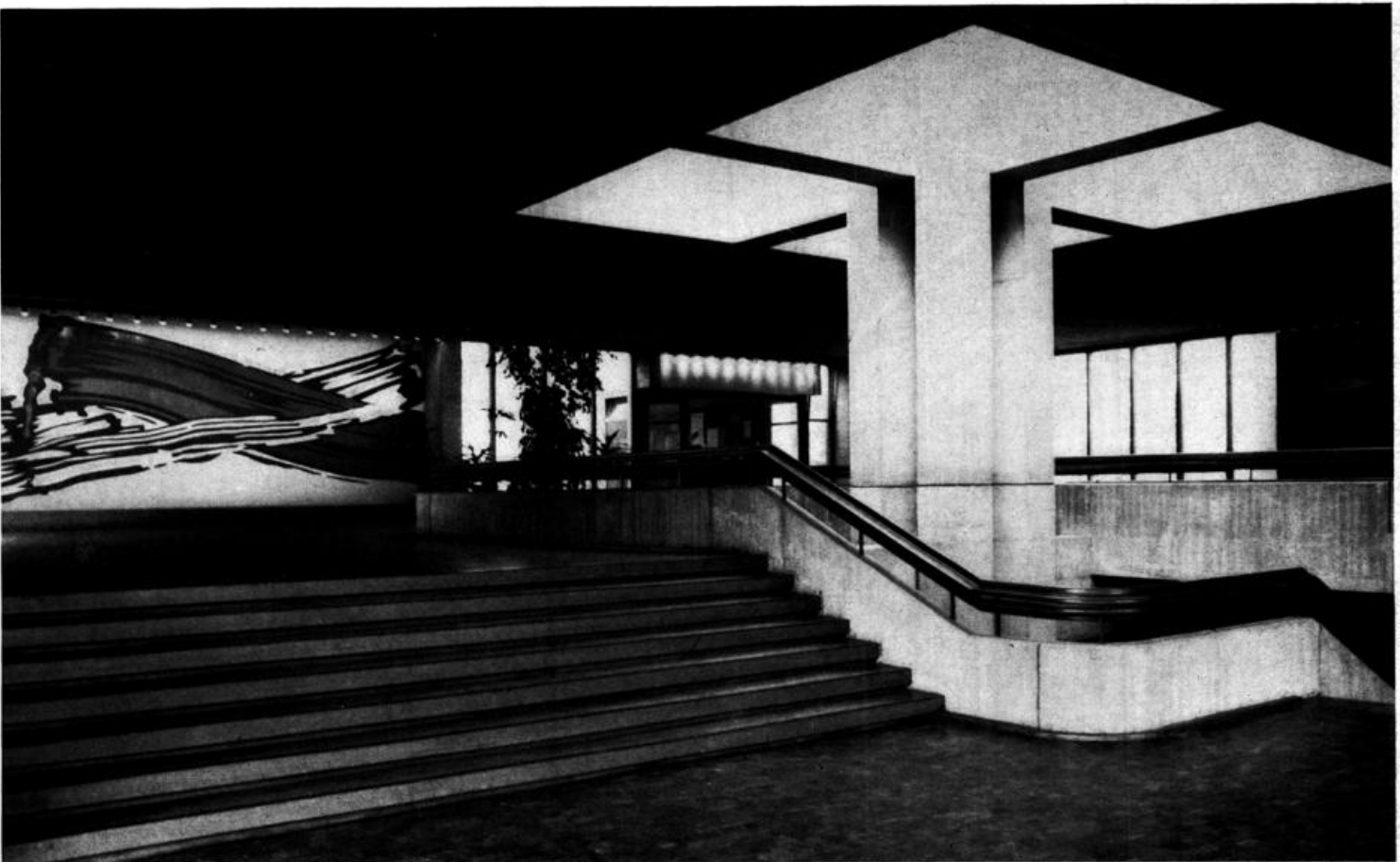
Blick in den Hörsaal-Vorraum der theoretisch-vorklinischen Institute der Medizin (Wandbild: Roy Lichtenstein)