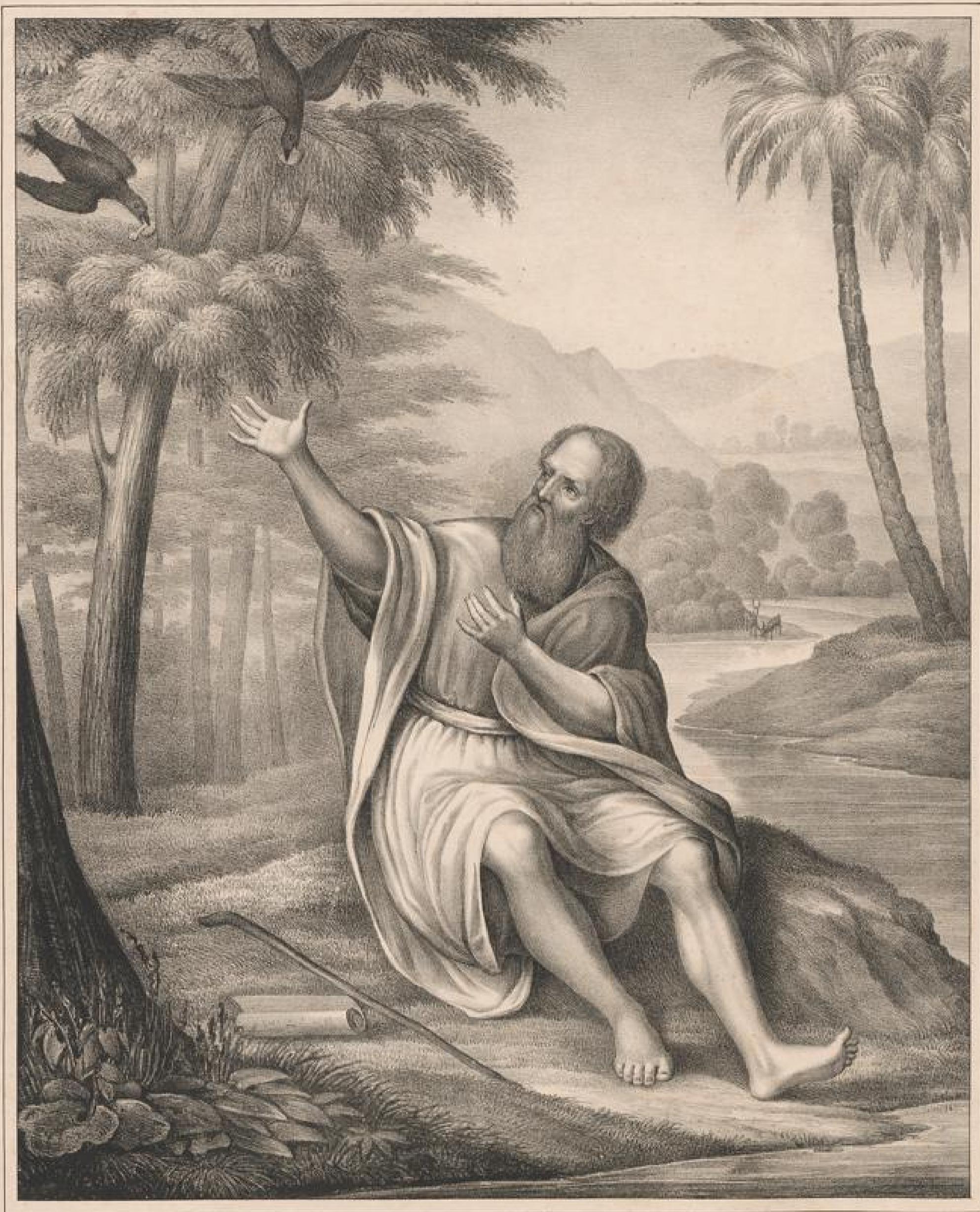
Elias am Bache Crith. 1. Kön. 17. 1-6.

Zum Besten der Diaconissen-Anstalt zu Kaiserswerth 4/Rhein.