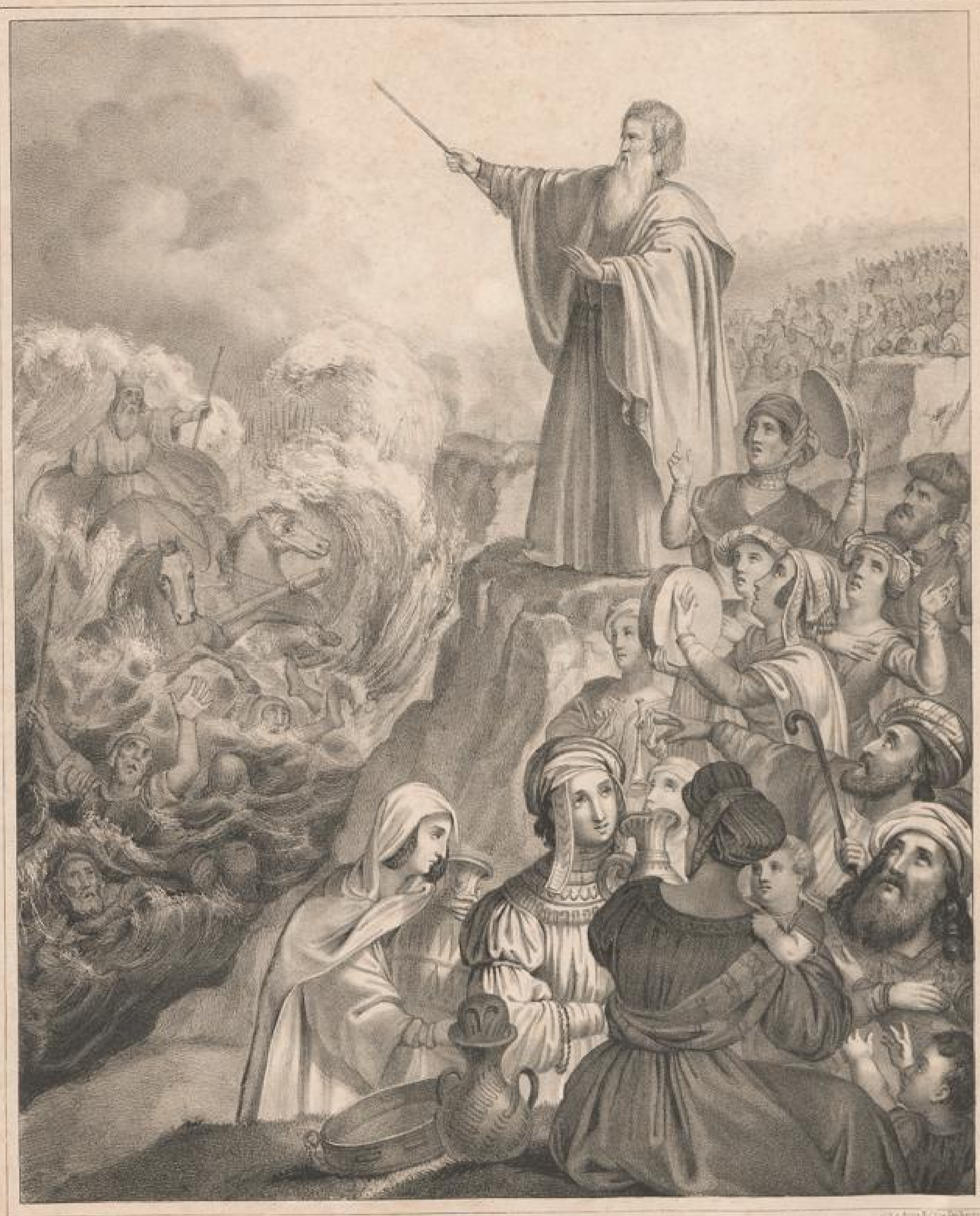
Pharaos Untergang im rothen Meere. 2. Mos. 14. 21. 31.

Zum Besten der Diaronsen - Anstalt in Kaiserswerth - Wien.