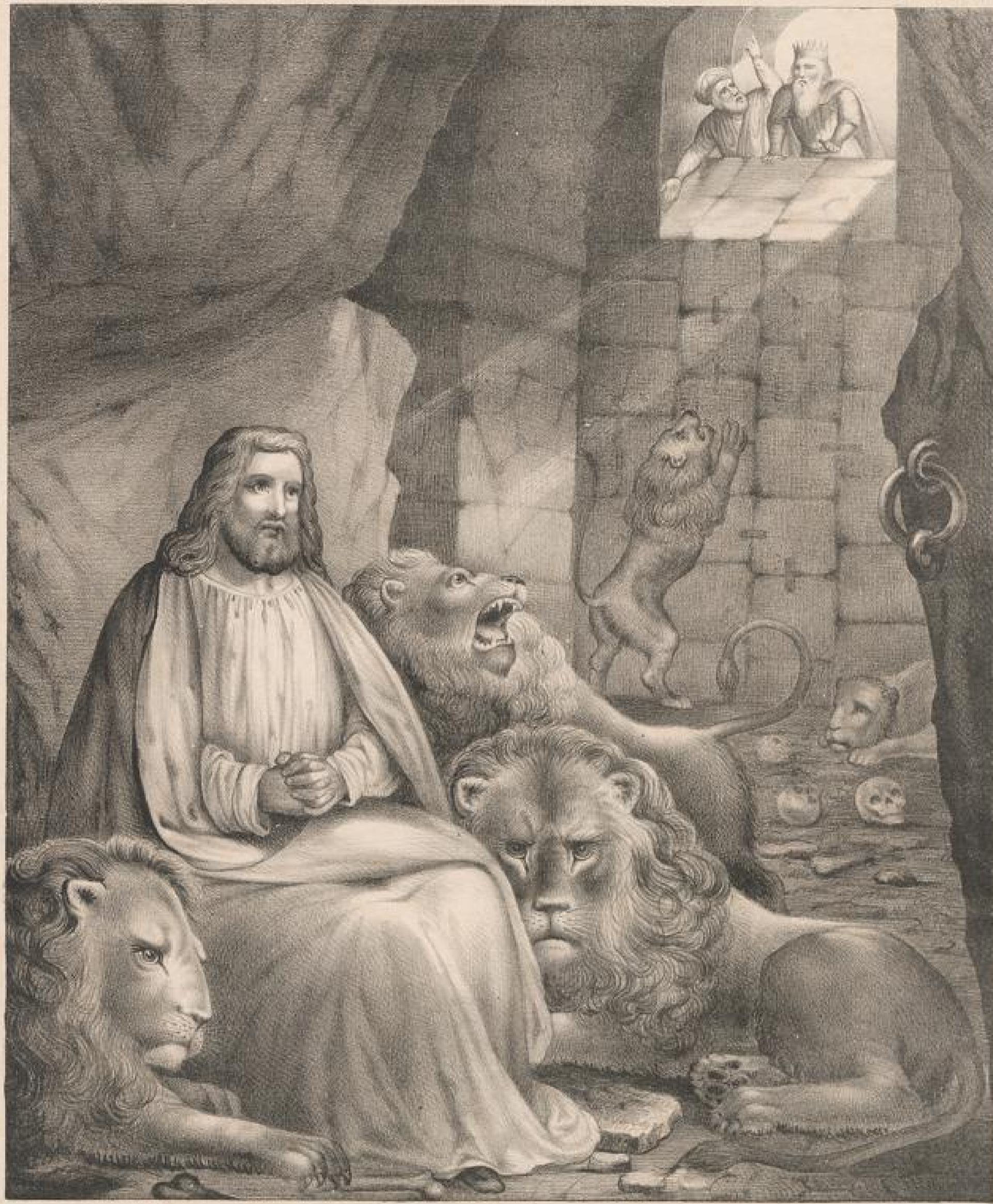
Daniel in der Löwendenube. (Dan. 6. 16-23.)

Zum Besten der Diakonissen-Anstalt in Kaiserswerth a/Rhein.