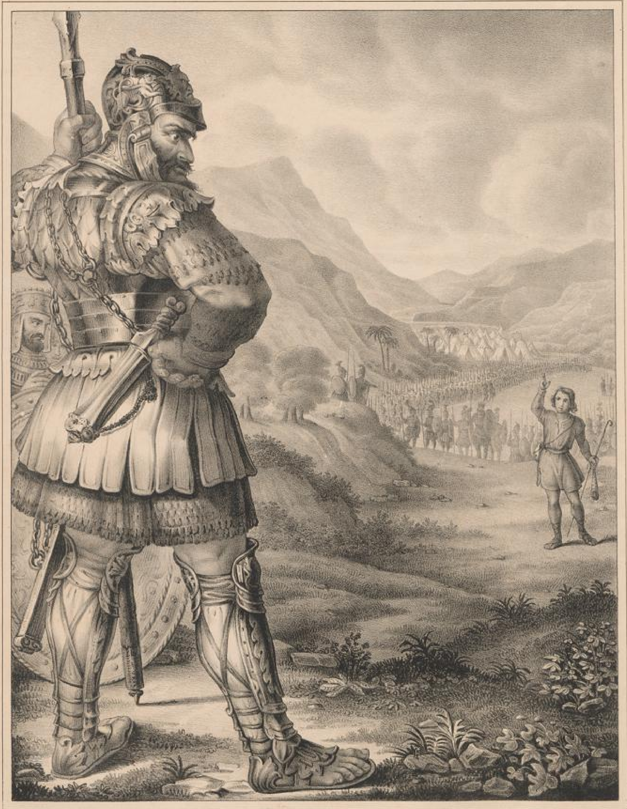
David und Goliath. 1 Sam. Vi. 32-39.

Zum Besten der Diakonissen-Anstalt zu Kaiserswerth * Rhein.