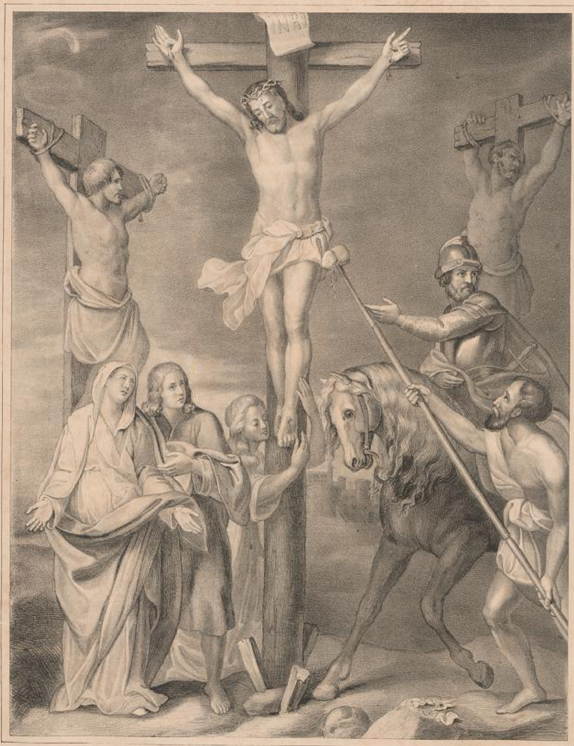
Jesus wird gekreuzigt. Luc. 23. 32-38

Zum Besten der Diaconissen-Anstalt zu Kaiserswerth v. Rhein.