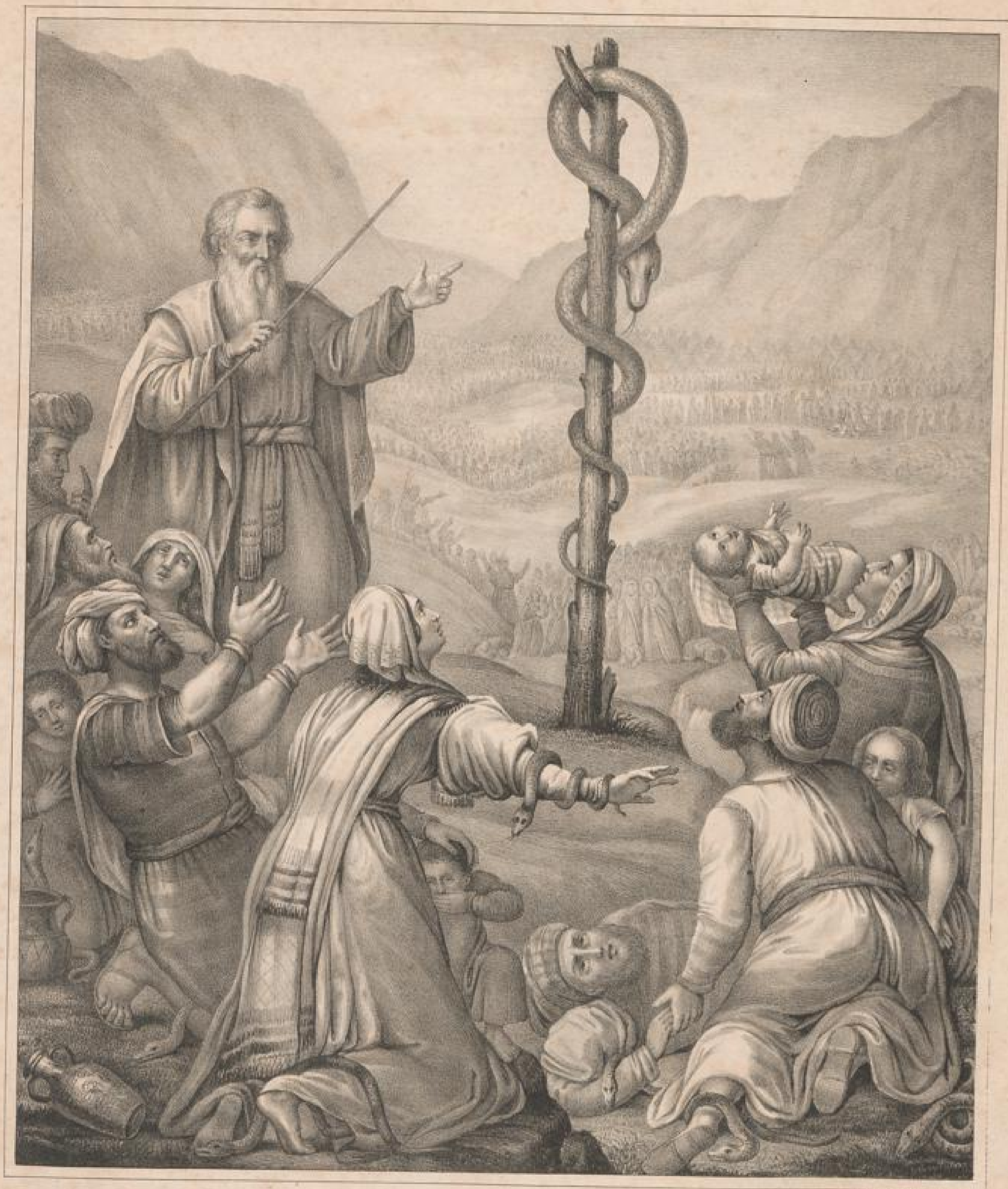
Moses erhebt die ehernen Schlange. 4. Mos. 17, 11. 31.

Zum Gellen der Diaconissen-Anstalt zu Kaiserswerth *Ahein.