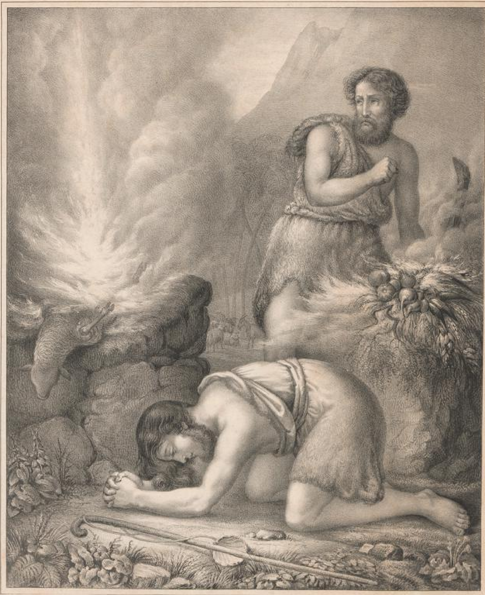
Abels und Kains Opfer. 1. Mos. 4, 3-7.

Zum Besten der Diakonissen-Anstalt zu Kaiserwerth *Apost.