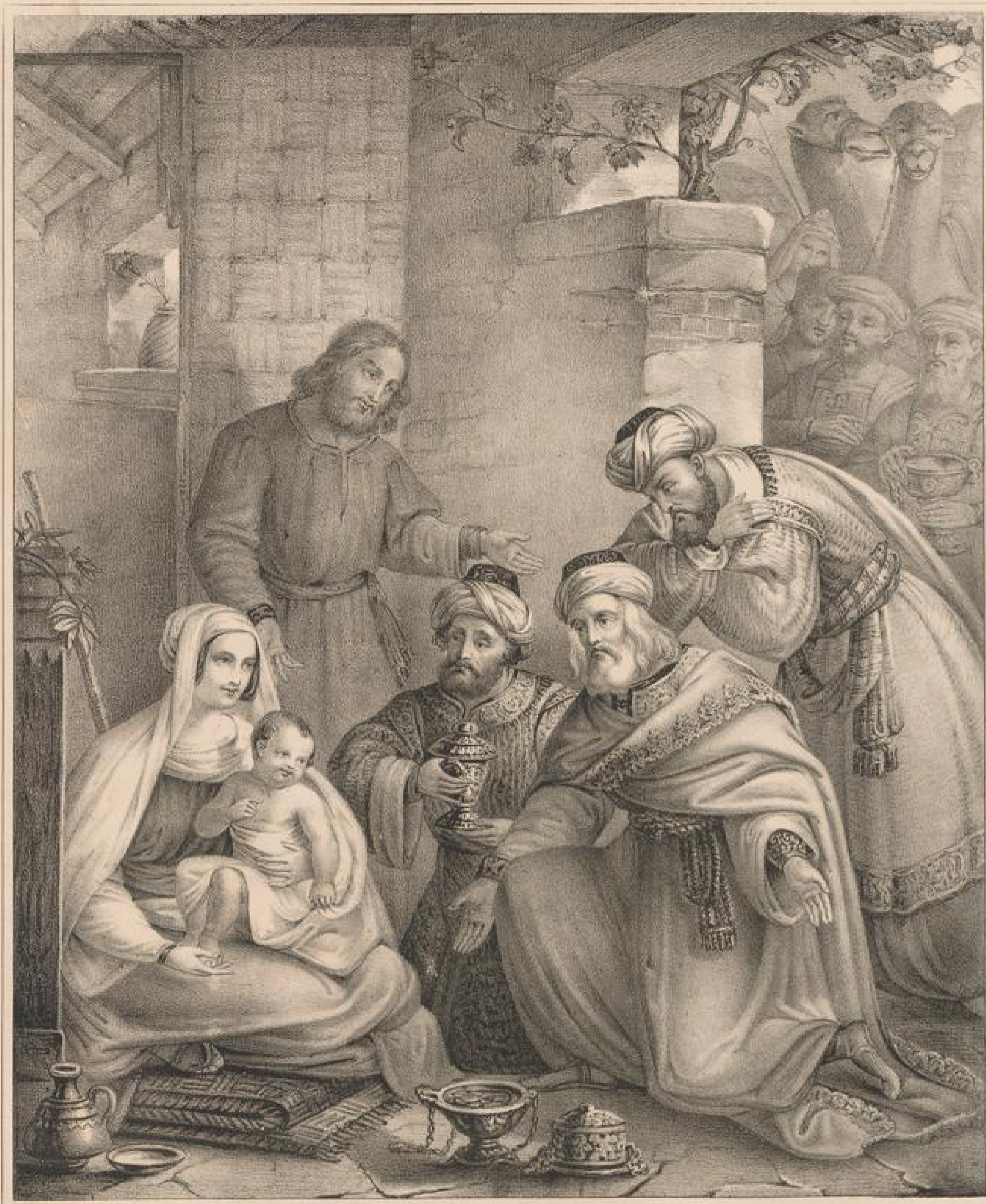
Die Weisen aus dem Morgenlande. Matth. 2, 1-12.

Zum Besten der Diakonissen Anstalt zu Kaiserwerth in Rhein