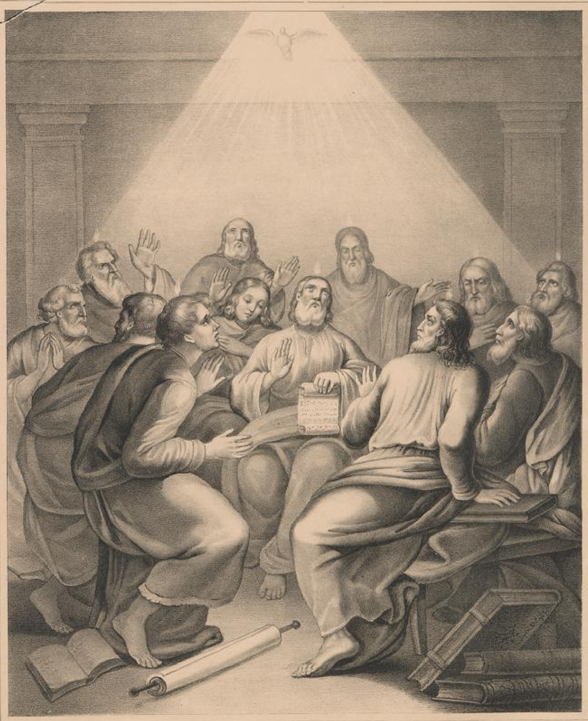
Ausgießung des h. Geistes auf die Apostel. Apost. Gesch. 2, 1-6

Zum Gebrauche der Diaconissen-Anstalt zu Kaiserswerth " Rhein.