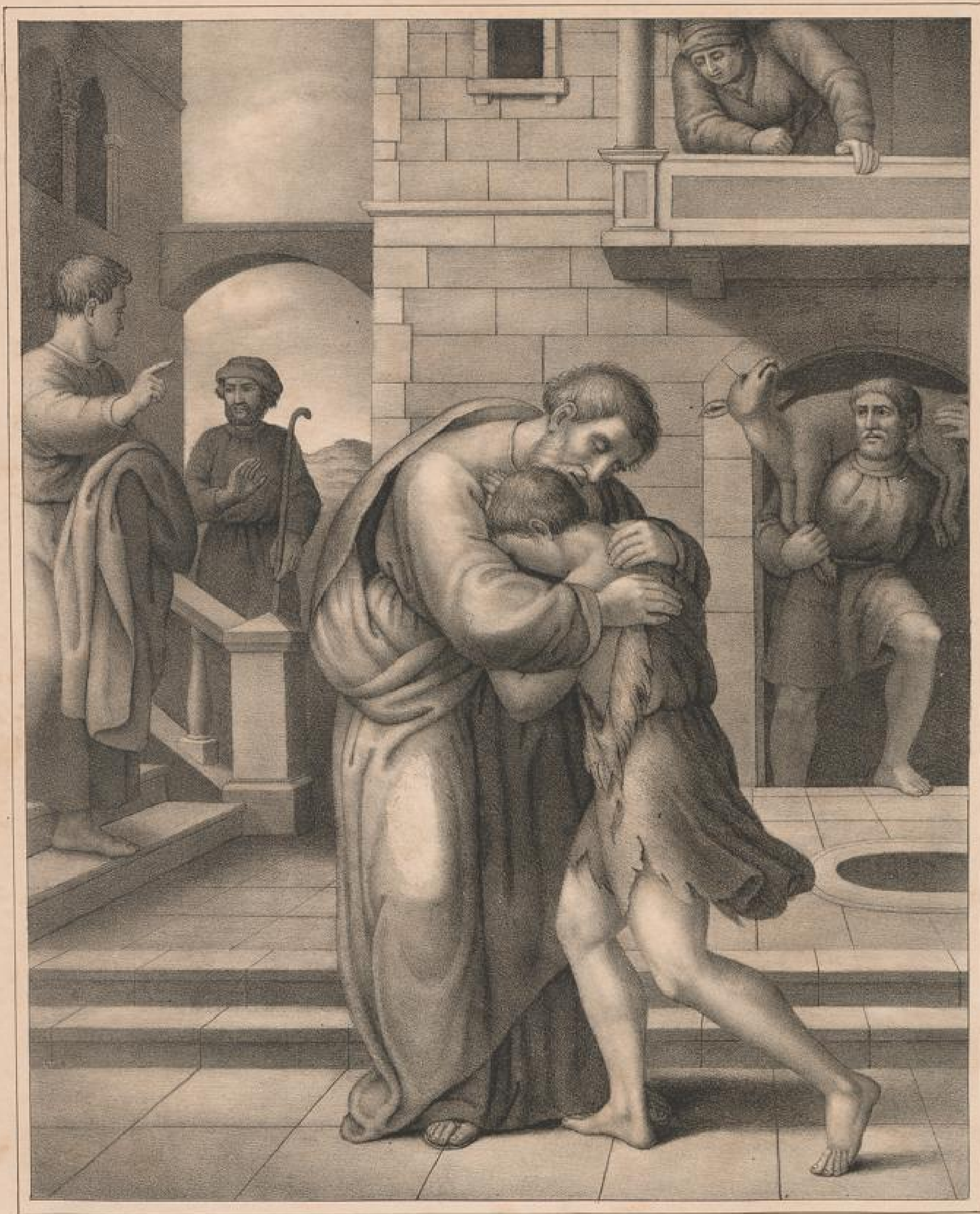
Der verlorne Sohn kehrt zurück. Luc. 15. 11-32.

Zum Besten der Diakonissen-Anstalt zu Kaiserwerth a/Rhein.