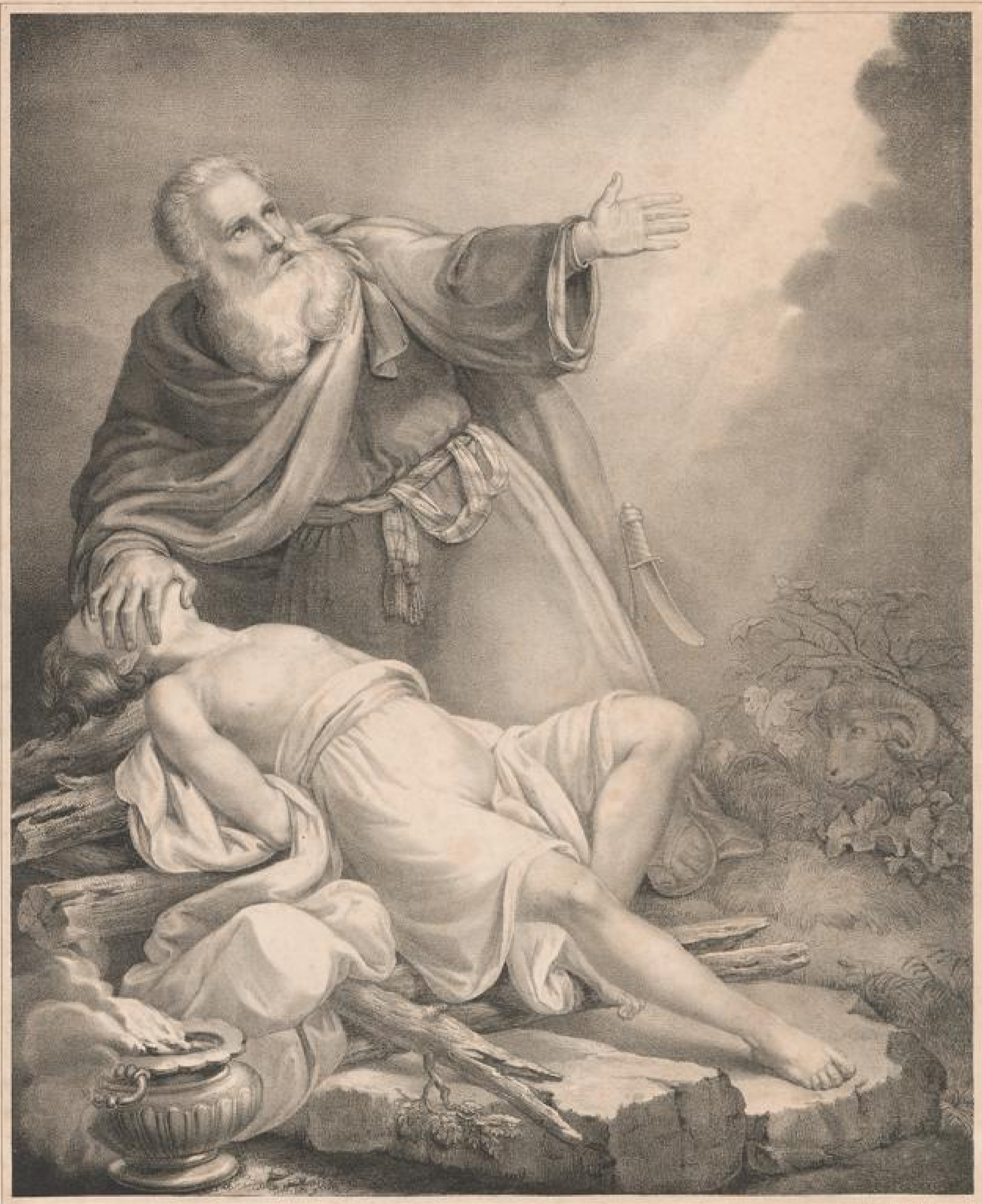
Abraham will Isaac opfern. 1. Mos. 22. 1-19.

Zum Besten der Diakonissen-Anstalt zu Kaiserswerth 1800.