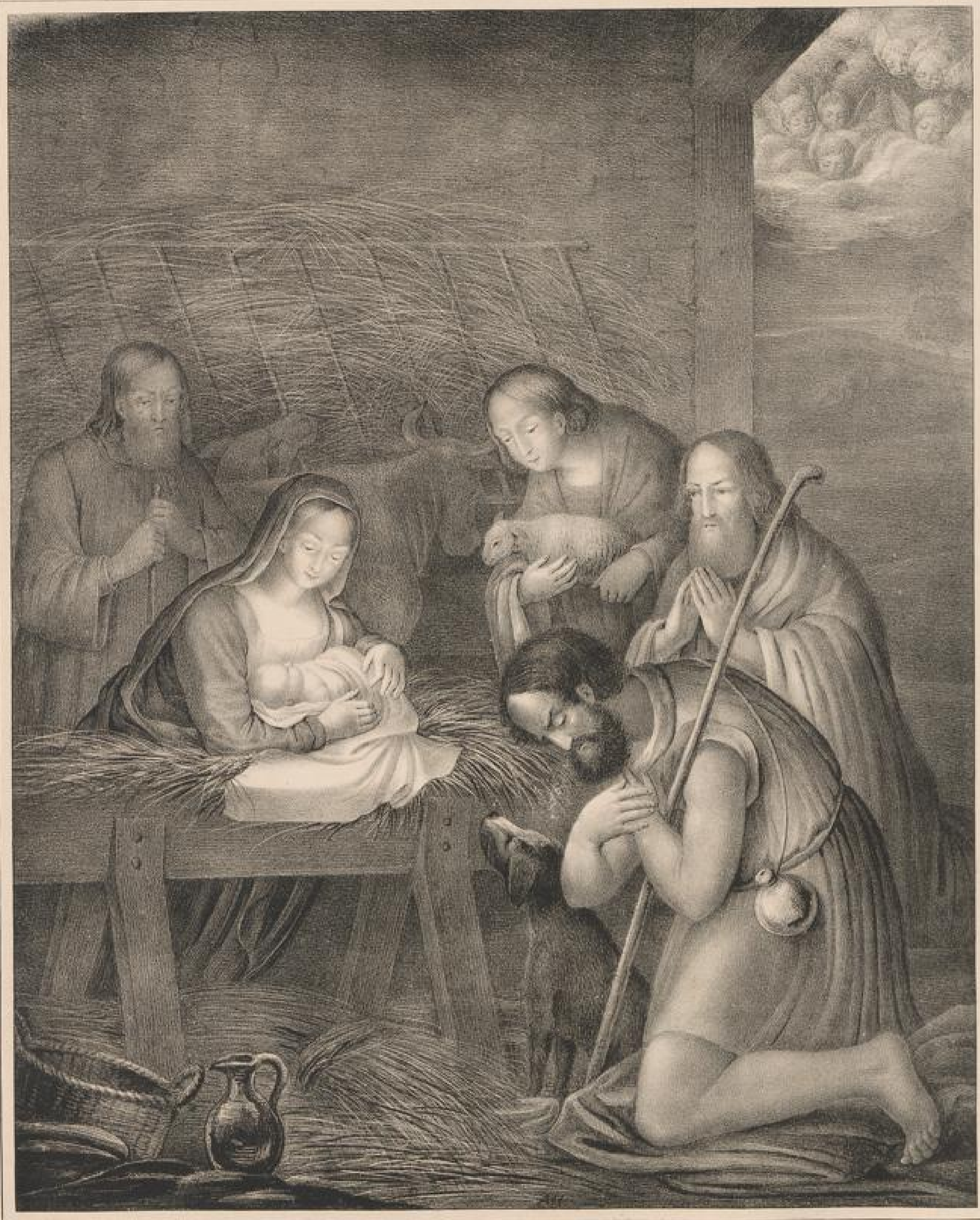
Die Hirten bei der Krippe Jesu. Luc. 2, 8-16.

Zum Besten der Diakonissen-Anstalt zu Kaiserswerth 8/ Rhein.