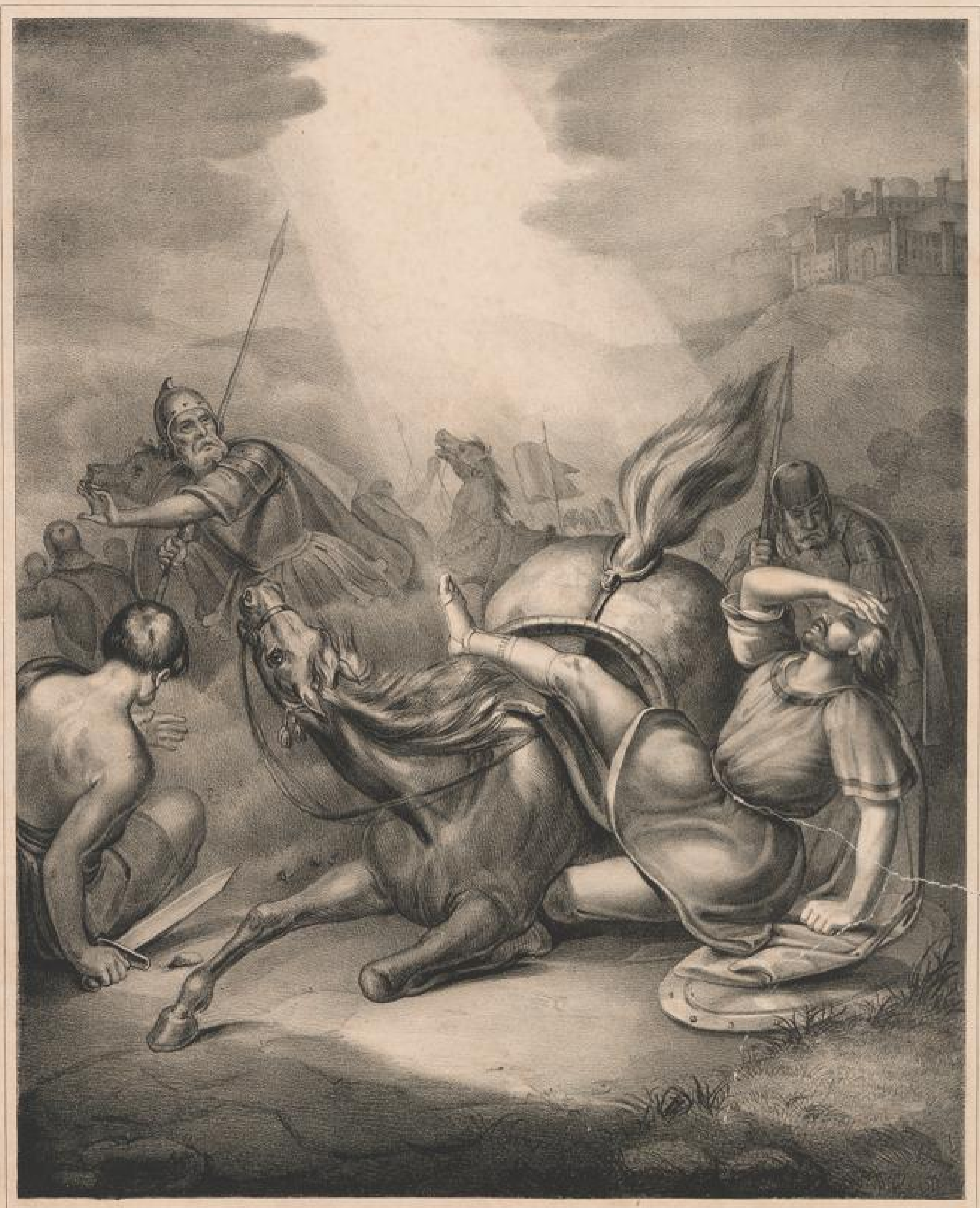
Pauli. Bekehrung Apost. Gesch. 9, 1-5.

Zum Belten der Diacoinnen Anstalt zu Kaiserwerth * Rhein .