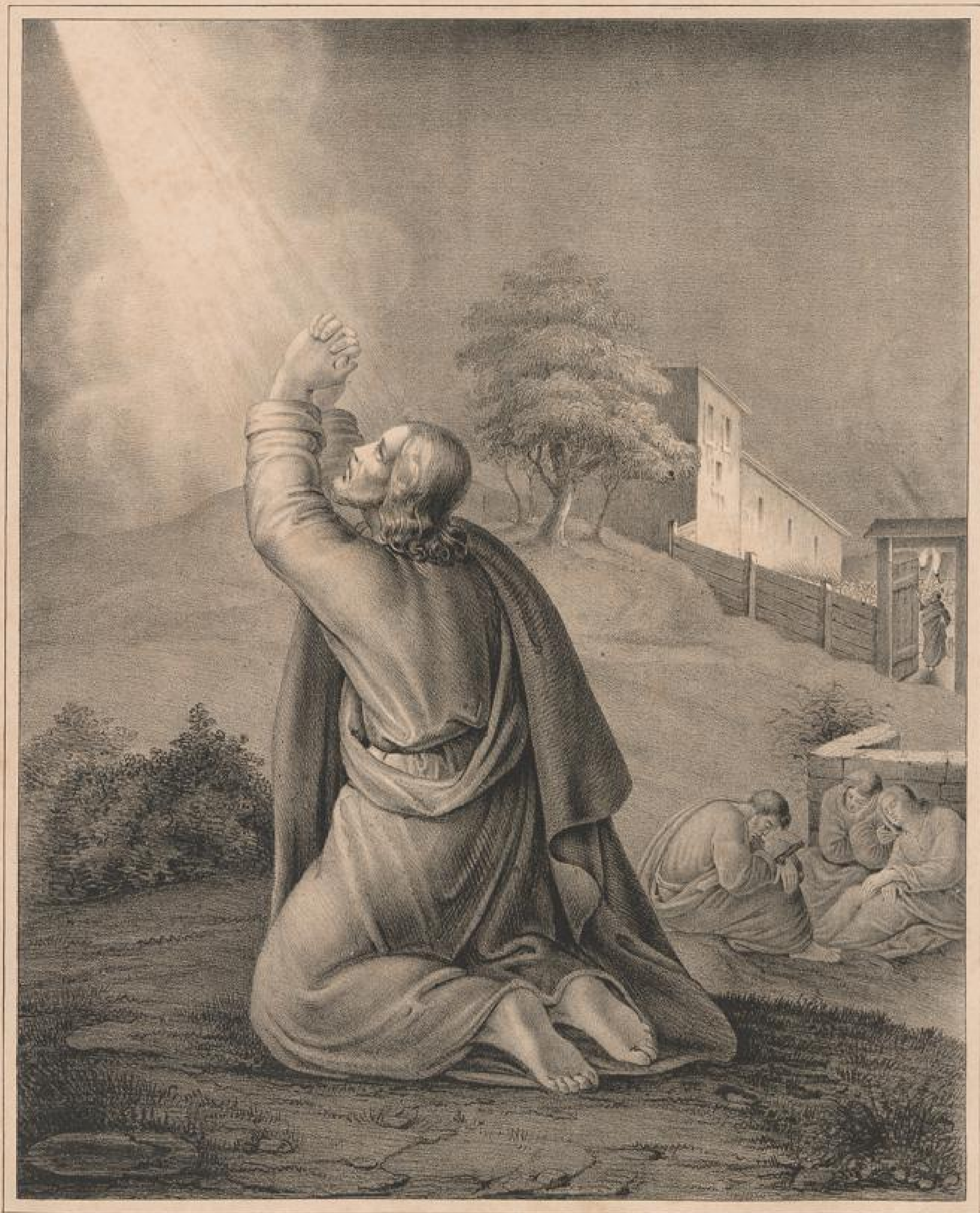
Jesus in Gethsemane. Luc. 22, 39-46.

Zum Besten der Diakonissen-Anstalt zu Kaiserswerth 6 / Weim.