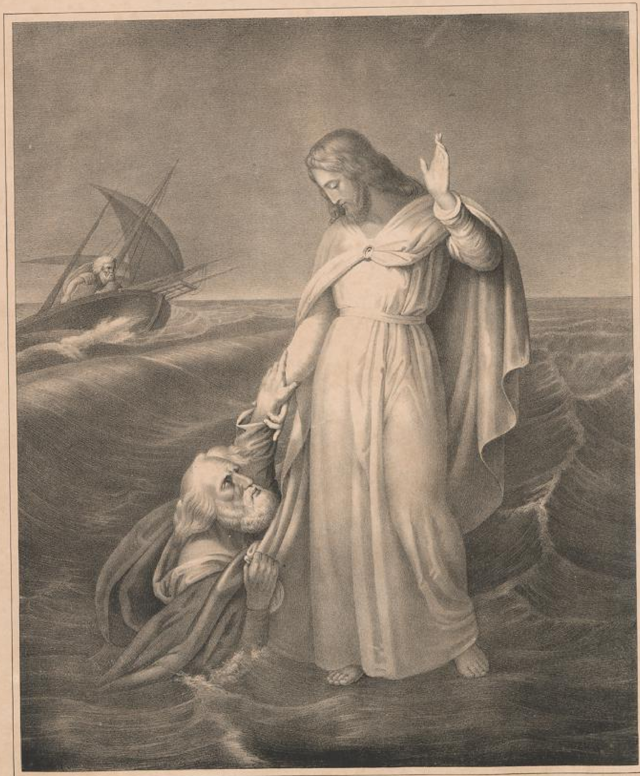
Jesus und Petrus auf dem Meere. Matth. 14. 22-33.

Zum Gebrauche der Diaconicalen-Anstalt zu Kaiserwerth * Rhein.