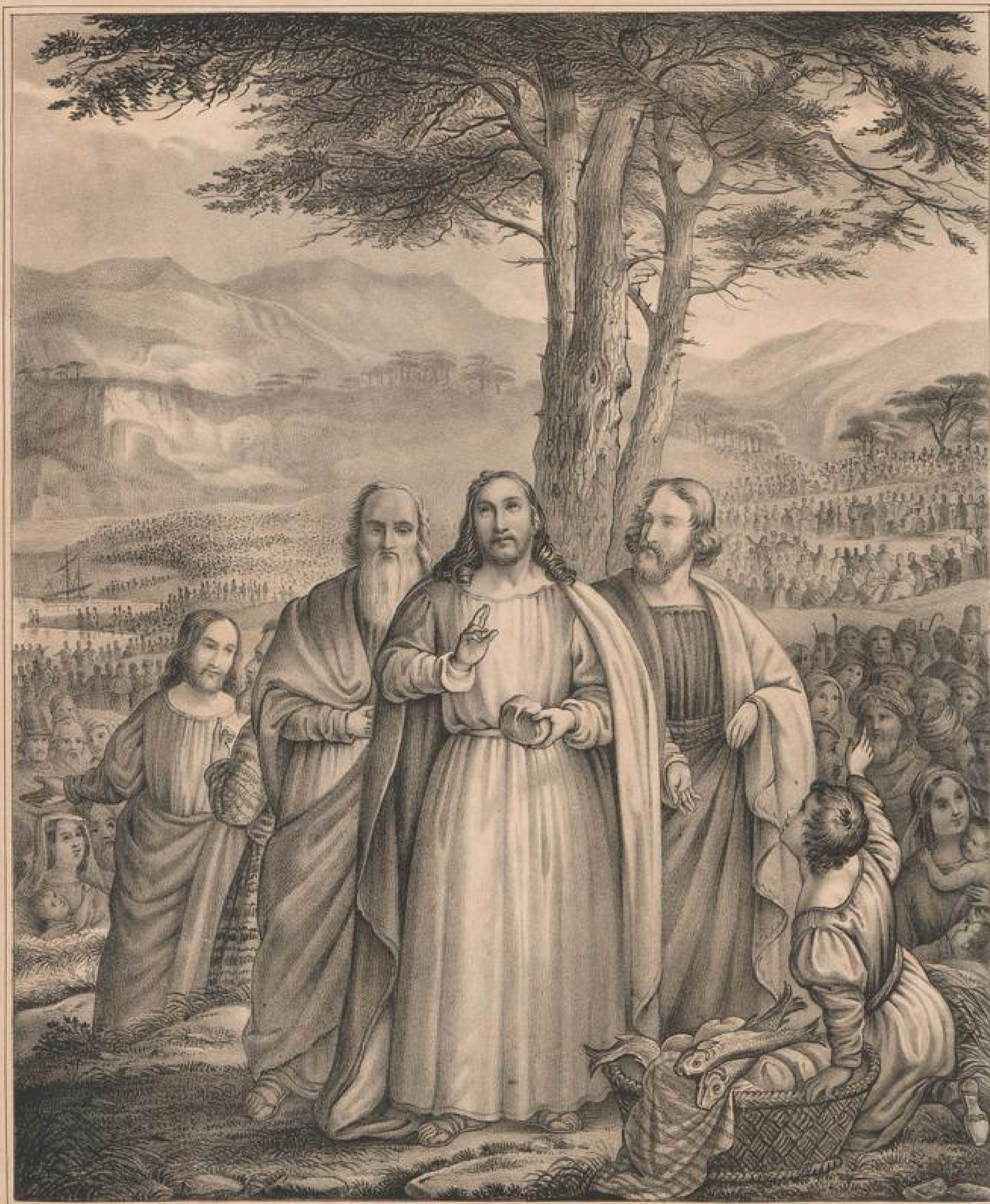
Jesus speist 5000 Mann. Joh. 6. 1-15.

Zum Nutzen der Dincowitsen-Anstalt zu Hartsenwerth 9. Bdem.