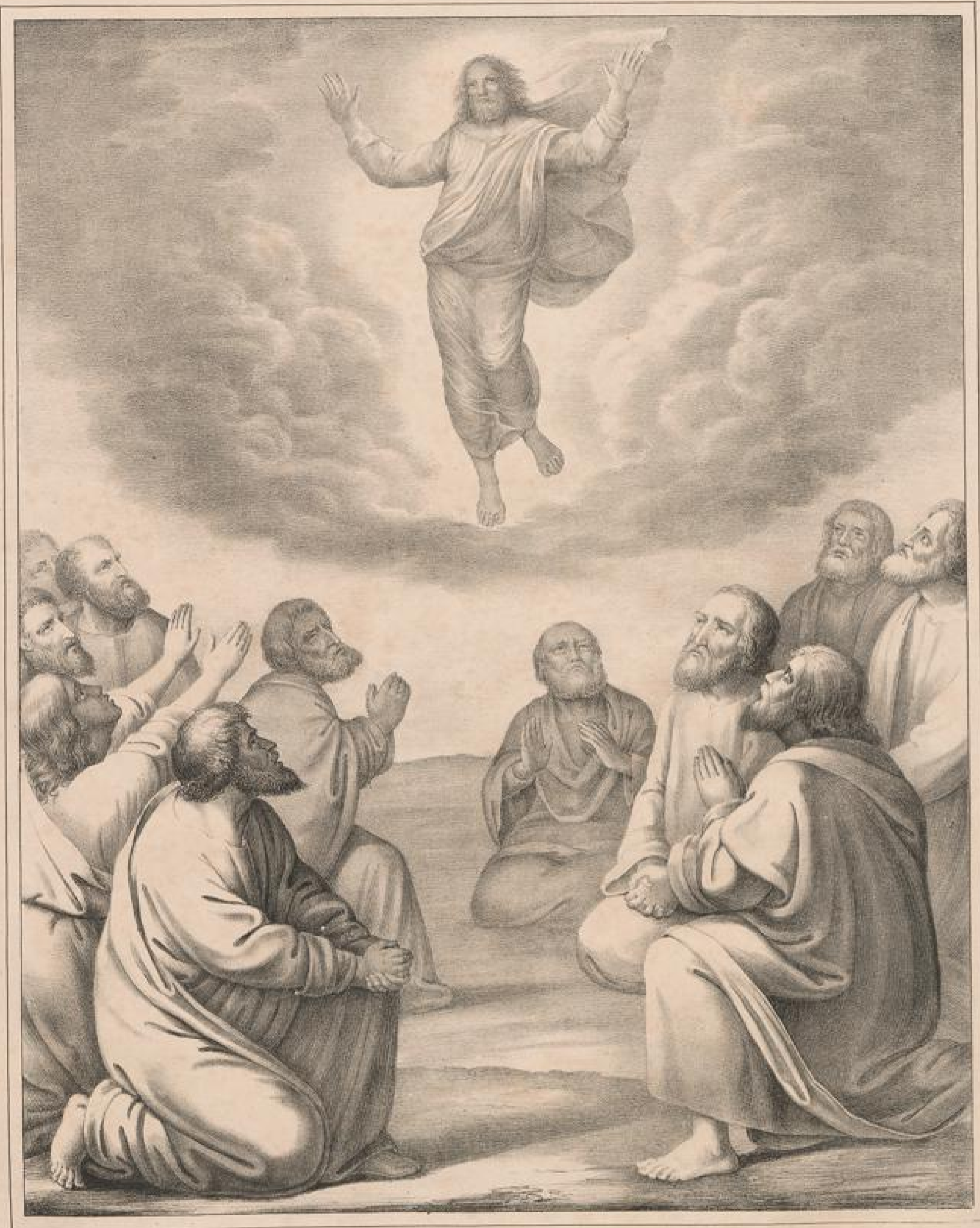
Jesus Himmelfahrt. Luc. 24. 30 - 33

Zum Nutzen der Diakonissen - Anstalt zu Baiserswerth */Rhein.