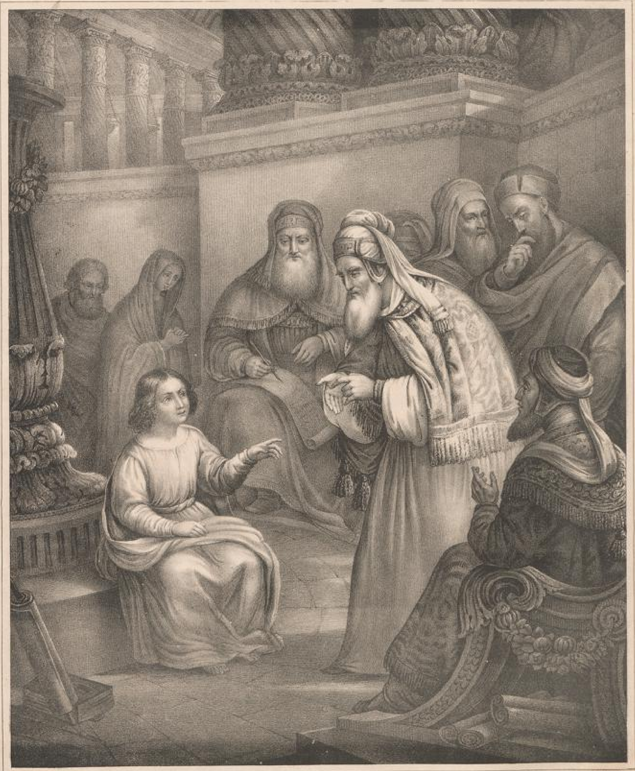
Der zwölffjährige Jesus im Tempel. Luc. 2. 41-50

Inm. Verlen der Diakonissen-Anstalt zu Kaiserwerth. Rhein