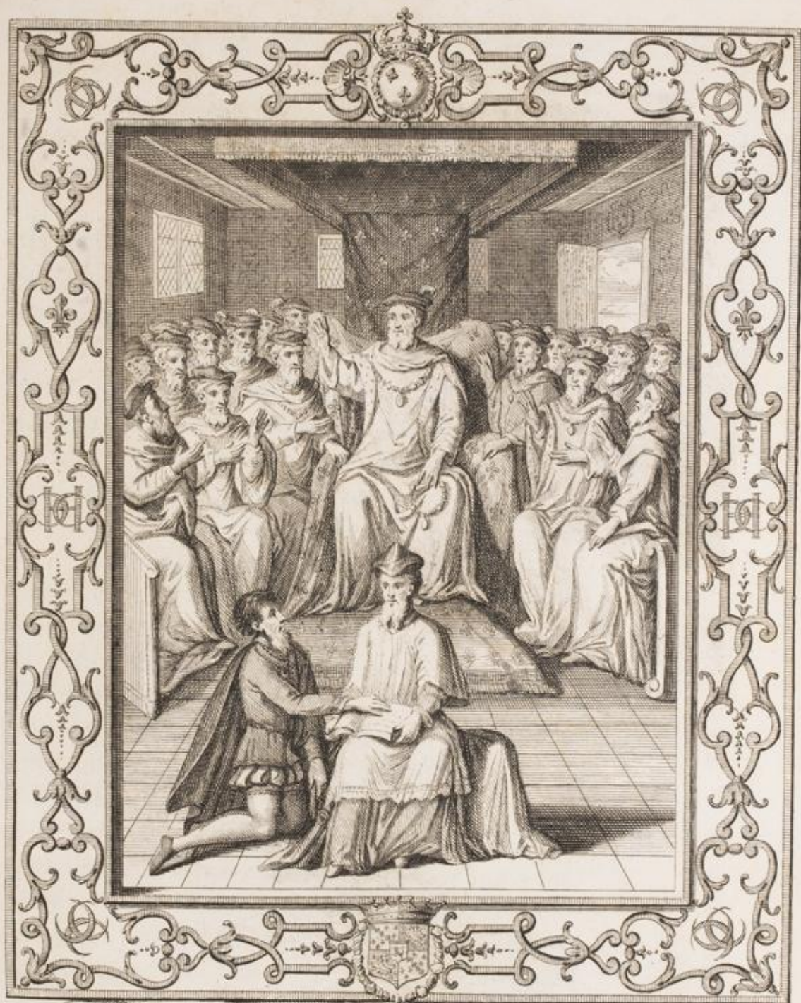
MARTIN du BELLAY Seigneur de Langey, presse Serment de Chevalier de S t Michel en 1555.