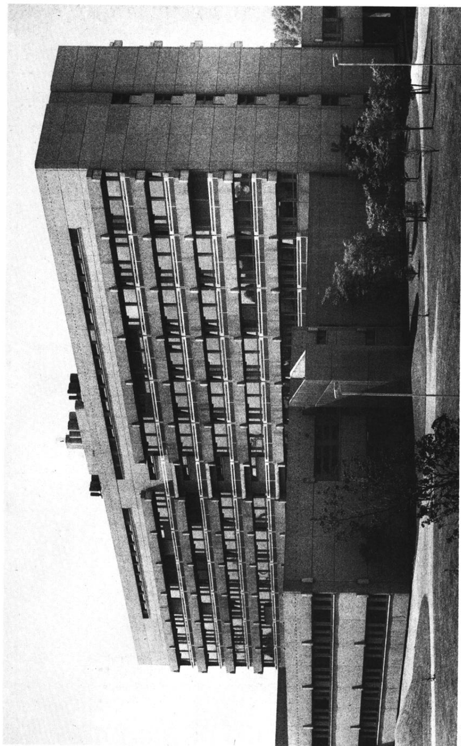
Blick auf die Institutsbauten der theoretisch-vorklinischen Medizin