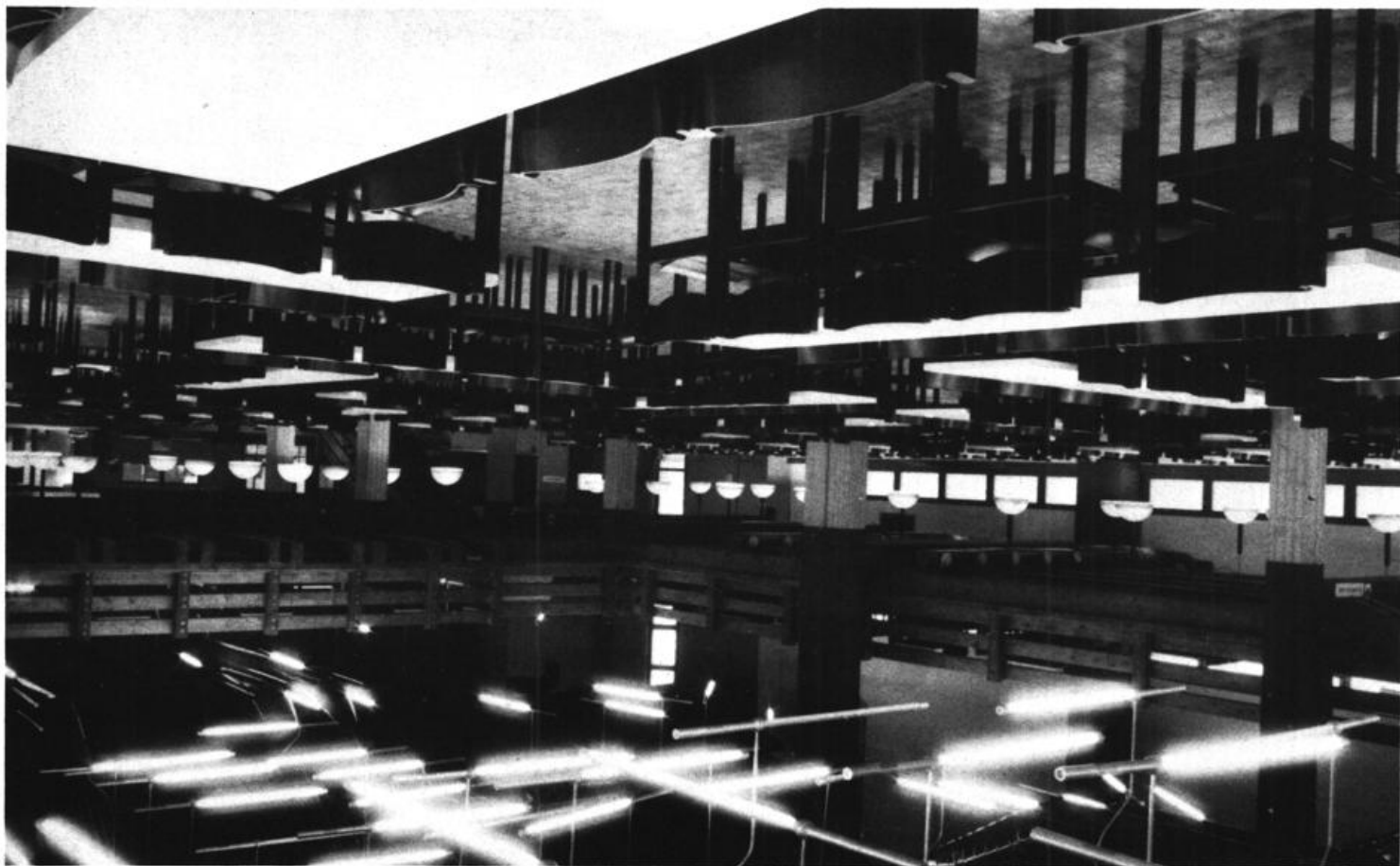
Blick in die neuerrichtete Mensa |