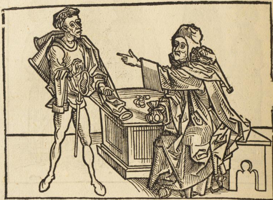
De iudeis quorum etiam plerisque hisce temporibus Hierosolymis manent.