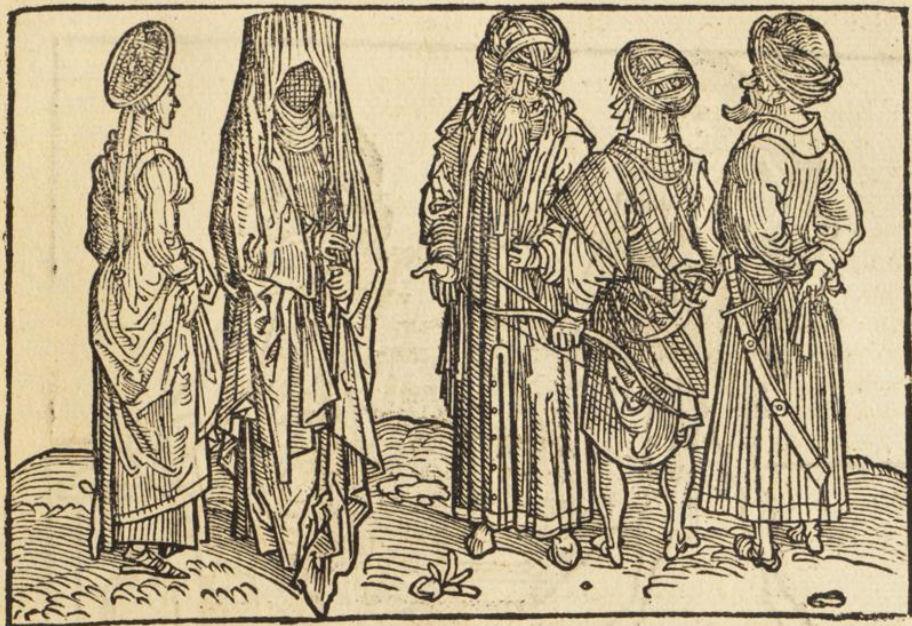
Sarraceni lingua et littera vtuntur Arabica hic inferius su bimprefsa.