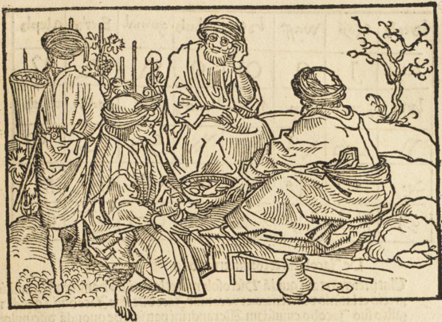
De Surianis qui Hierosolymis et locis illis manentes etiam se asserunt esse christianos.