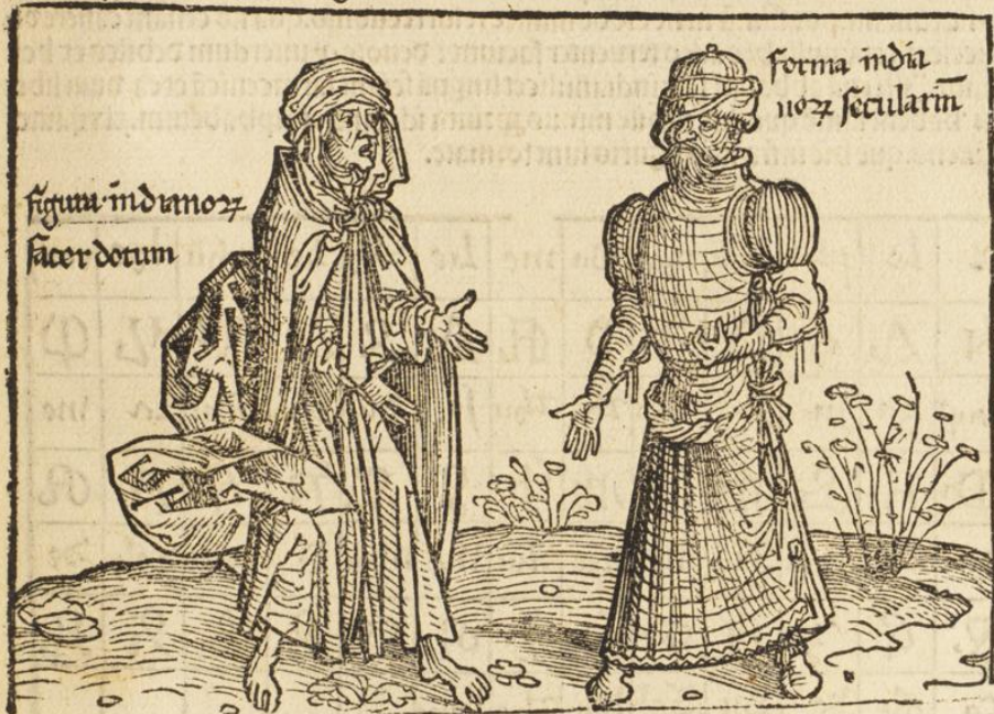
figura indianoꝝ sacerdotum