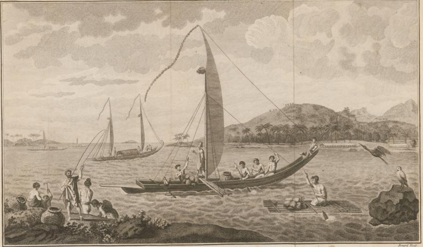
Vue de l'Isle d'Otaheiti et de plusieurs Pirogues