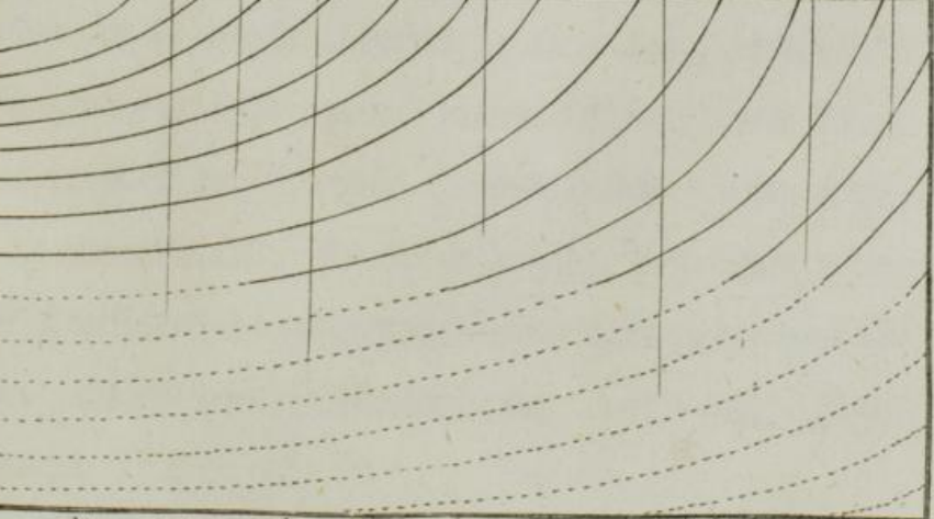
Zweiter senkrechter Durchschnitt