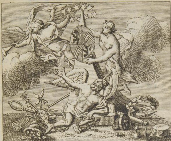
Inventé et Gravé par B. Audran.

A SON EXCELLENCE MONSEIGNEUR LE COMTE D'OCIESZYNO-BRUHL, COMTE DU S. EMPIRE ROMAIN, Baron de Forſta & de Pfoerthen, Staroſte de Polangen, de Lipinsk & de Piaſecz- à iij