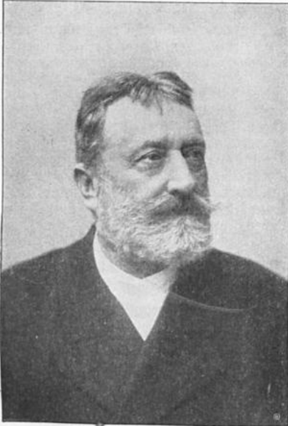
Ferdinand von Saar.