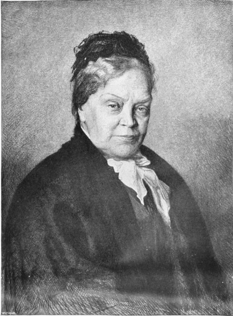
Marie v. Ebner-Eschenbach.