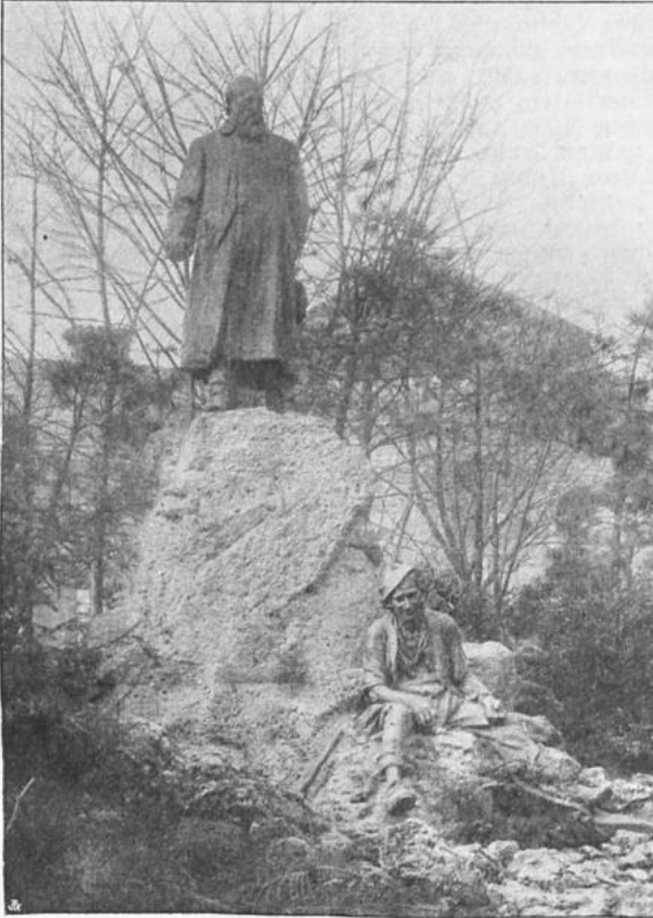
Anzengruber-Denkmal (mit dem Steinklopferhans) in Wien.

darstellt, seine eigene, freie, aufgeklärte Lebens- und Weltanschauung. Mit Vorliebe richtet sich die Tendenz gegen Glaubenssätze und Einrichtungen der katholischen Kirche, die ihm wie so vieles andere nur als eine Phase in der Entwicklung der Menschheit erscheint. Das Dogma von der Unfehlbarkeit des Papstes und der Zölibat der katholischen Priester werden besehdet, die Priester als unglückliche und unfreie Geschöpfe oder als herrschsüchtige Bolterer, Erbschleicher und Unfriedensstifter gezeichnet. An den fittlichen Grundlagen der menschlichen Existenz will er nicht rütteln, aber er erklärt die Sittengesetze als unabhängig von dem jeweiligen Religionsbekenntnis, als tief in das menschliche Herz eingegraben. Und als echter Aufgeklärter ist er mit dem Glauben an einen persönlichen Gott fertig geworden und findet dafür Ersatz in inniger