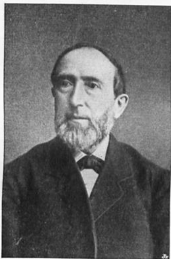
Friedrich Wilhelm Grimme.