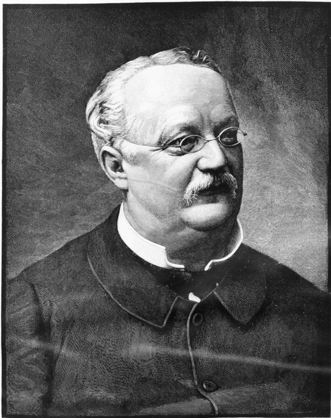
Conrad Ferdinand Meyer