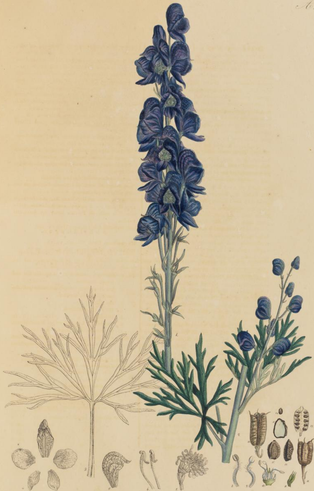
Aconitum vulgare L.