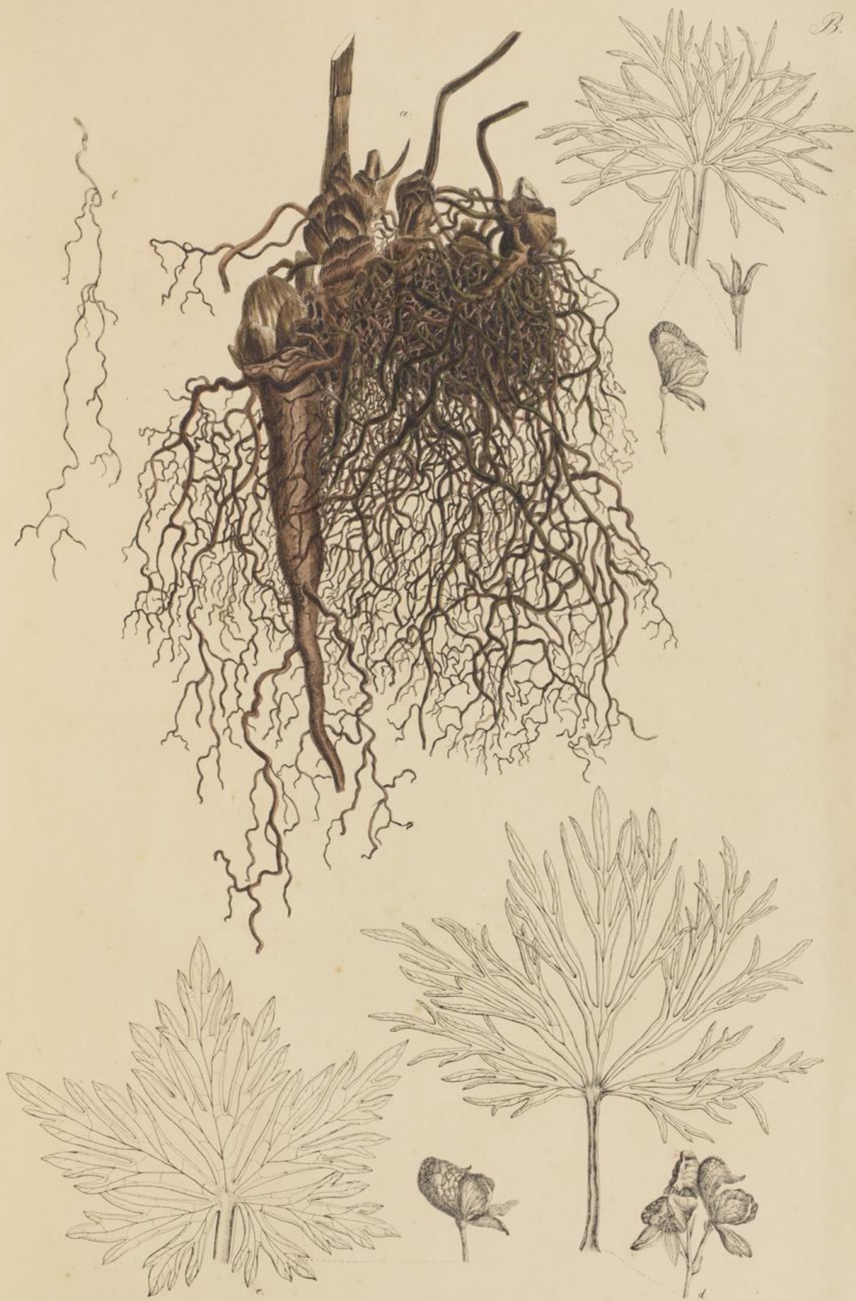
a. b. Radix Aconiti vulgaris Dec. c. Aconiti vulgaris angustifolium d. — — hiense e. — — latifolium