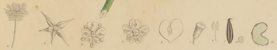
Cheerophyllum bulbosum L.