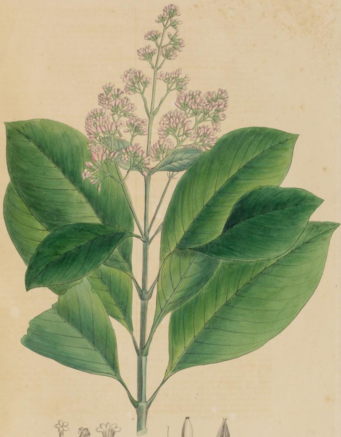
Cinchona scrobiculata , Humb. et B.