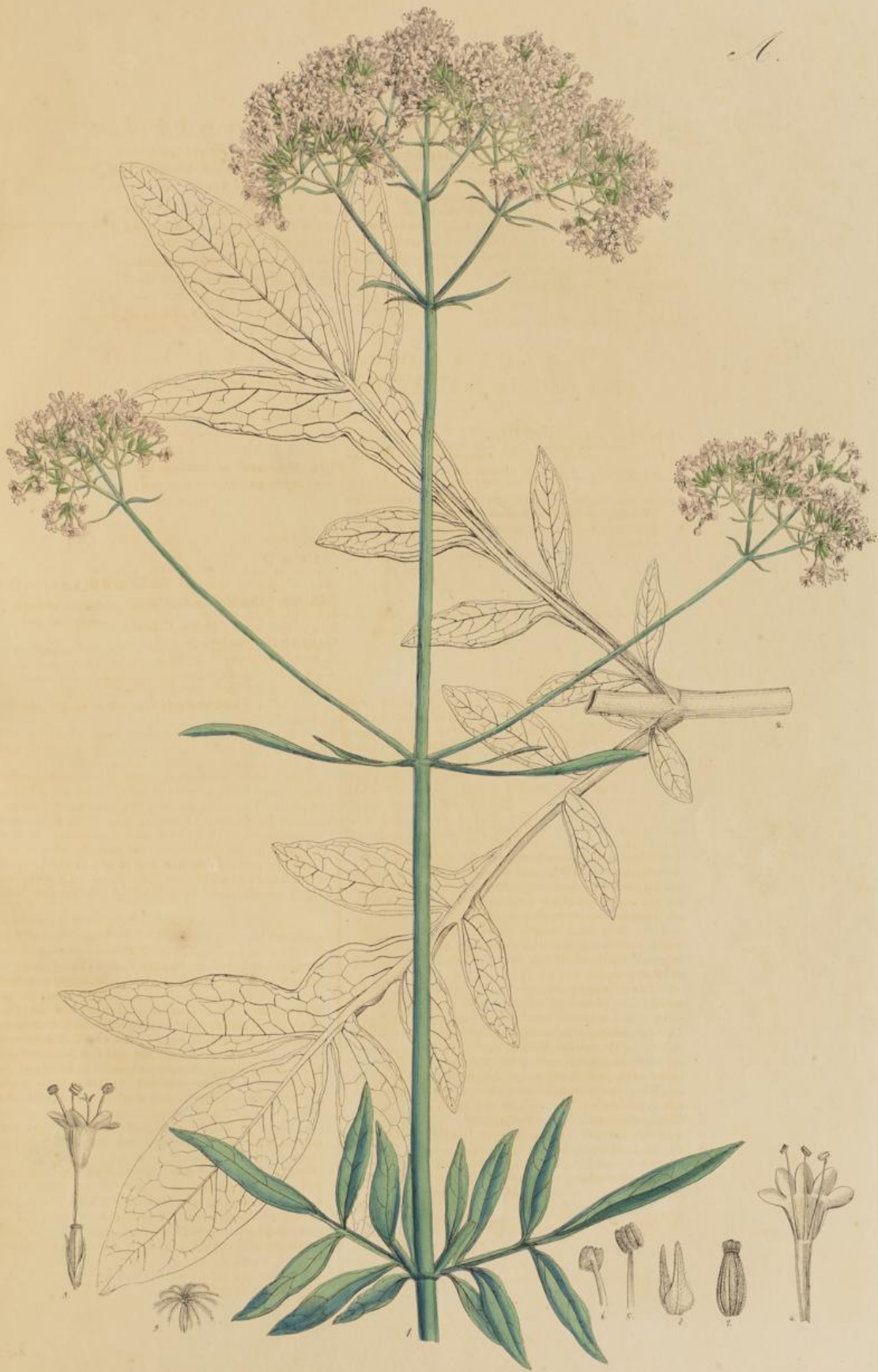
Valeriana Thu Sin.

Valeriana. S. 100 S. 101 S. 102 S. 103 S. 104 S. 105 S. 106 S. 107 S. 108 S. 109 S. 110 S. 111 S. 112 S. 113 S. 114 S. 115 S. 116 S. 117 S. 118 S. 119 S. 120 S. 121 S. 122 S. 123 S. 124 S. 125 S. 126 S. 127 S. 128 S. 129 S. 130 S. 131 S. 132 S. 133 S. 134 S. 135 S. 136 S. 137 S. 138 S. 139 S. 140 S. 141 S. 142 S. 143 S. 144 S. 145 S. 146 S. 147 S. 148 S. 149 S. 150 S. 151 S. 152 S. 153 S. 154 S. 155 S. 156 S. 157 S. 158 S. 159 S. 160 S. 161 S. 162 S. 163 S. 164 S. 165 S. 166 S. 167 S. 168 S. 169 S. 170 S. 171 S. 172 S. 173 S. 174 S. 175 S. 176 S. 177 S. 178 S. 179 S. 180 S. 181 S. 182 S. 183 S. 184 S. 185 S. 186 S. 187 S. 188 S. 189 S. 190 S. 191 S. 192 S. 193 S. 194 S. 195 S. 196 S. 197 S. 198 S. 199 S. 200