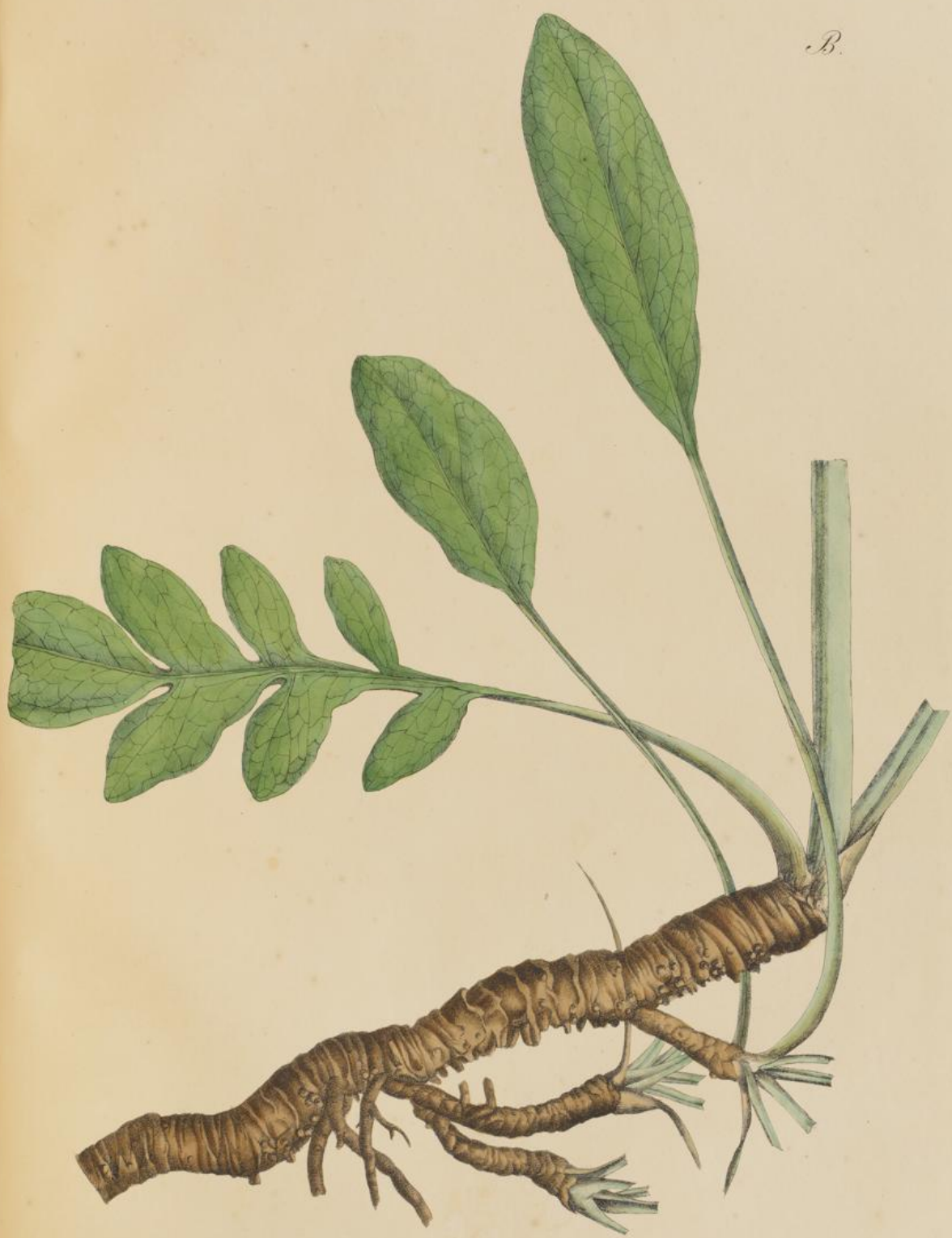
Valeriana Phac. Lin.