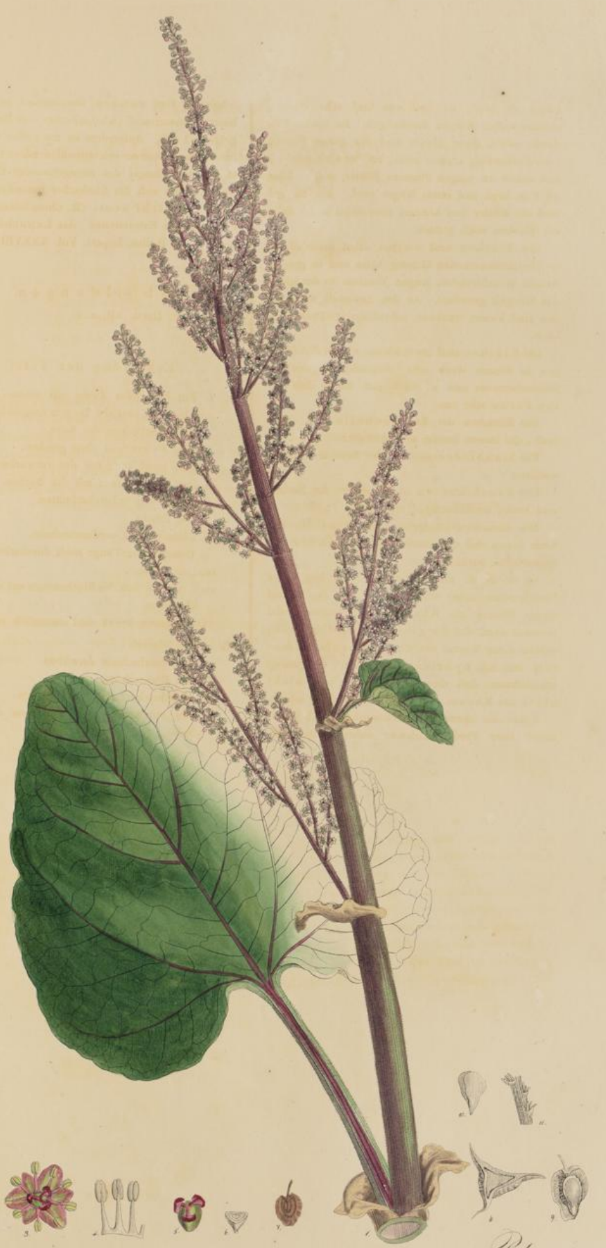
Rhuim australe Desv. 31. a

ist ein rein berügte den Harz von den Gerbstoff den Gerbstoff andere von der Lohn, in der von ihm enthal- ten ist. Blatt von gleicher Größe. andere Blatt einen. bestehen. mit der Deck- e verpackt. an der unter