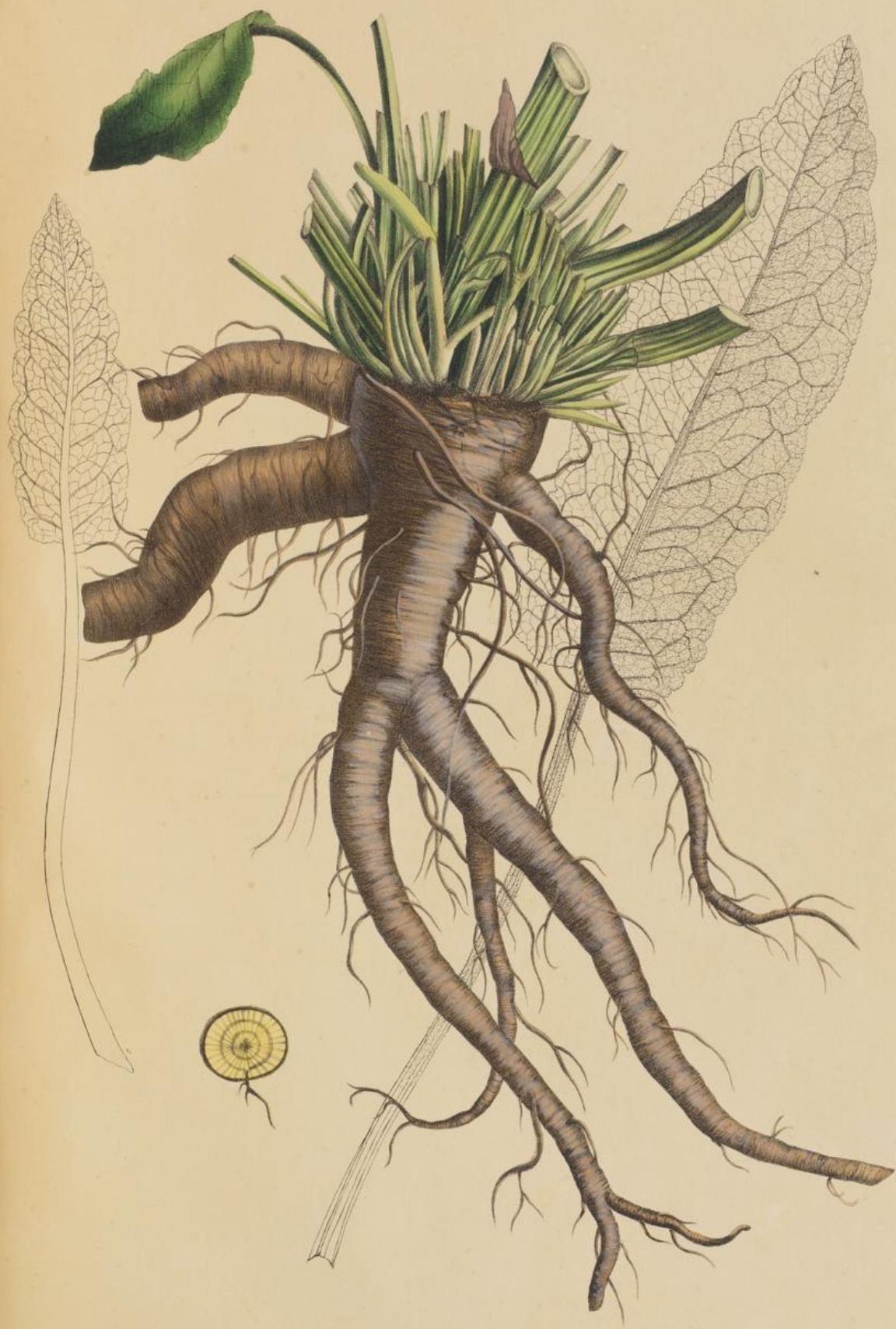
Rumex pratensis Koch.