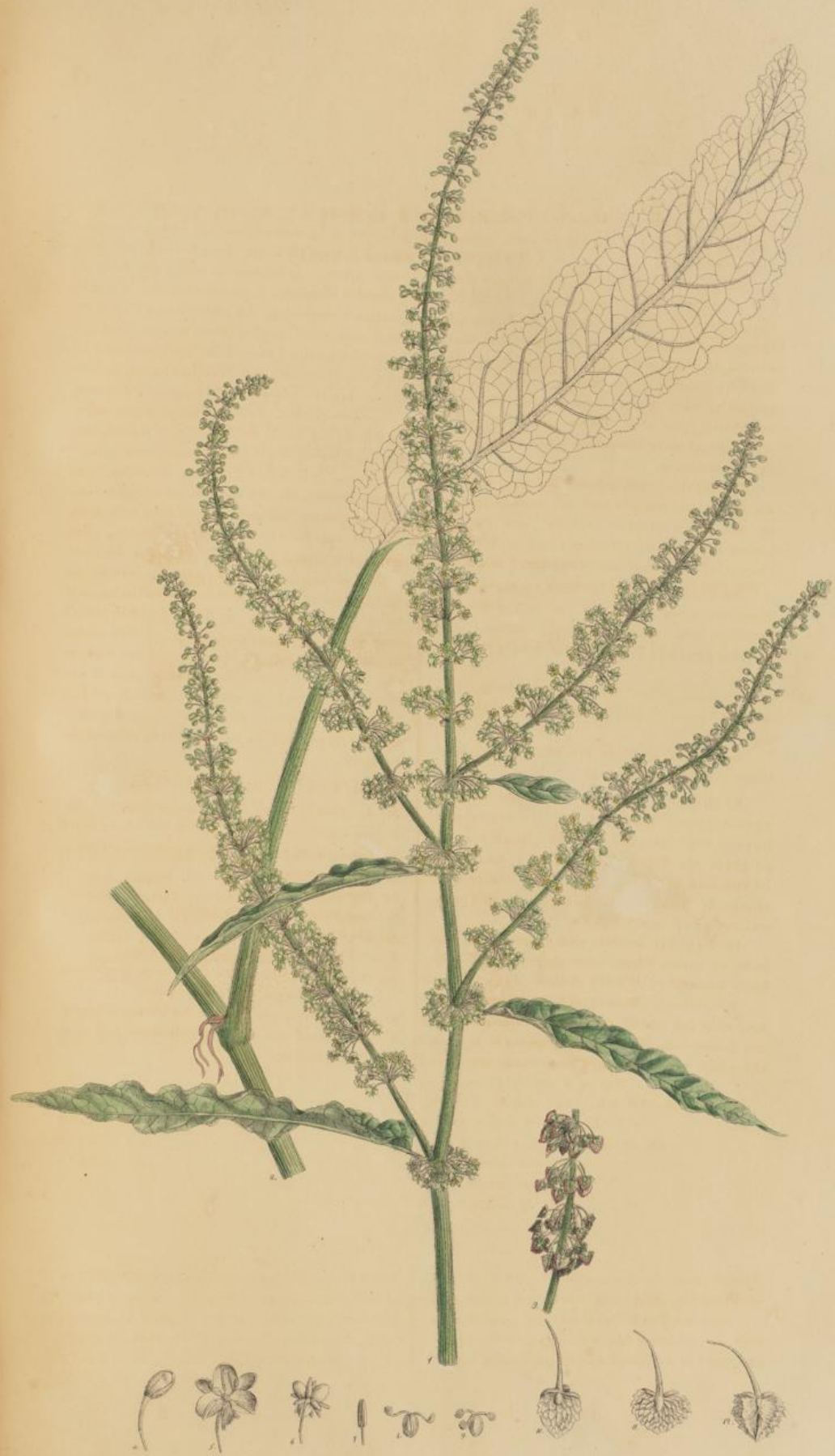
Rumex pratensis Koch.

blüht der Wur- den: Das schwe- mung-pflanze ist die Fülle in weite einen sehr dichte Kappe er- weilen lockigen rauhliche Fi- Flocken, Gallu- g mit Abetung igen sehr wale- der Wurzel von sinnen wird. Darstellung eine als die ein- der Stelle sind, ekann. Wir von der Erde igen wurde sie im Herbst noch Frühjahr (1811) ), diese reich- chbaren Samen higkeit dieser er noch auf die art eine hybride ins constanten Feln. angch. nlicher Geite. Gröfien. den, so gemein- sieht. loben Klappen schalt und zwei