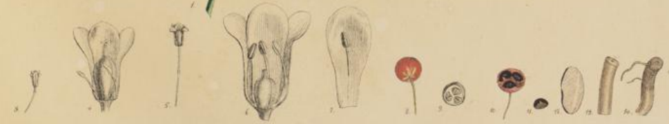
Asparagus officinalis Lin.