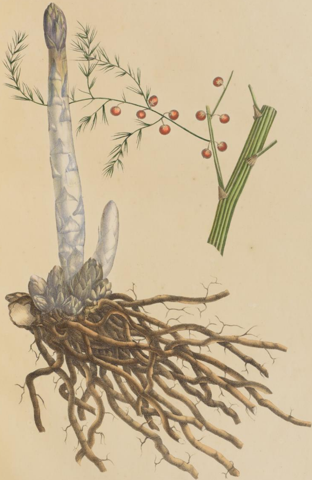
Asparagus officinalis Linn.