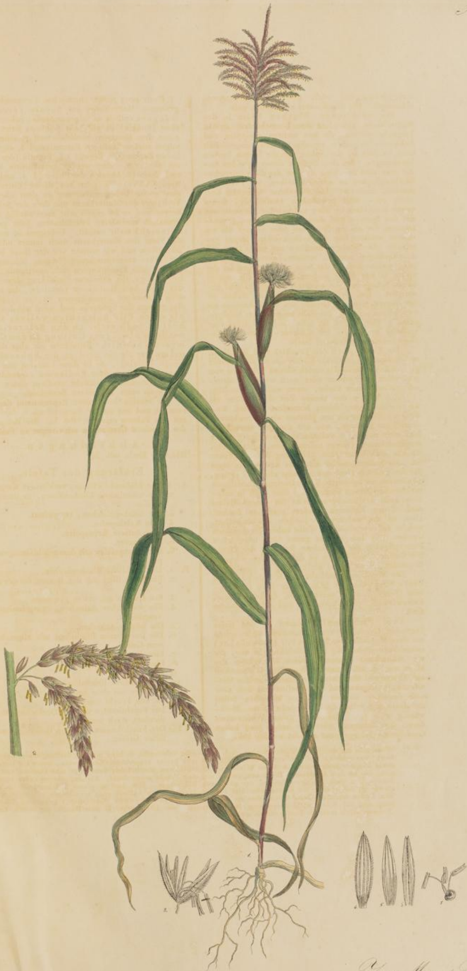
Zea Mays Linn.

ruckung de zerteile vo schwarzen fenes (el) 31 eines gan a, eingebr (der wika die wika die wika und Buch Katerwuch e abenicht er Schwam ich, das der em ge kein hi mo über er nicht ger find bei un behoren, das ende Spha deschen in der so pli Triger oder das Ganze n, so ge spiacen, es Cassio er das Ma cellis ge t mit Gyn erend. diese wüch häufig, weil aus der G at der Göt er Beträuf an faden st t. t. dazweil wärlcher ruzig Kir nd der obem a. gpravit mit abyschide schapper (i fel, in mit diese Schoppen er die legt eine stiele und such (oder hütren) theile ist etwa ägigwoll wurd theure. Beschr re nach. Eov