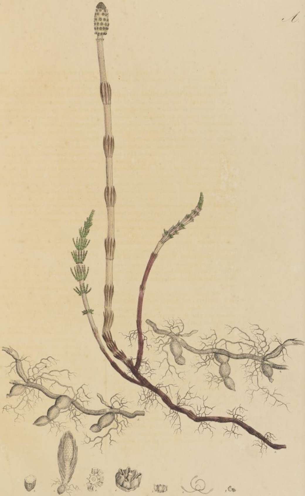
Equisetum arvense L.