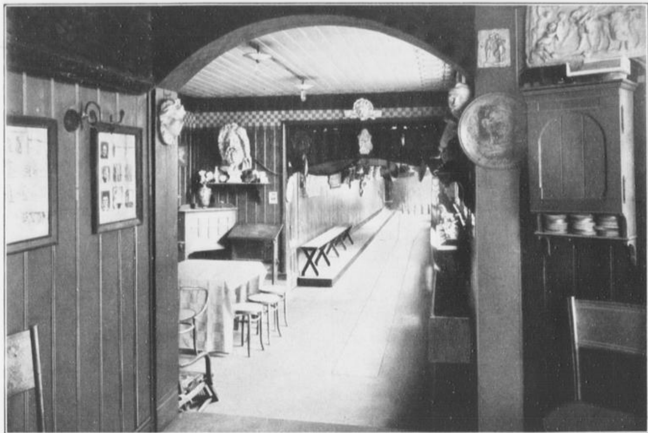
Kegelbahn im Ausstellungsgebäude.