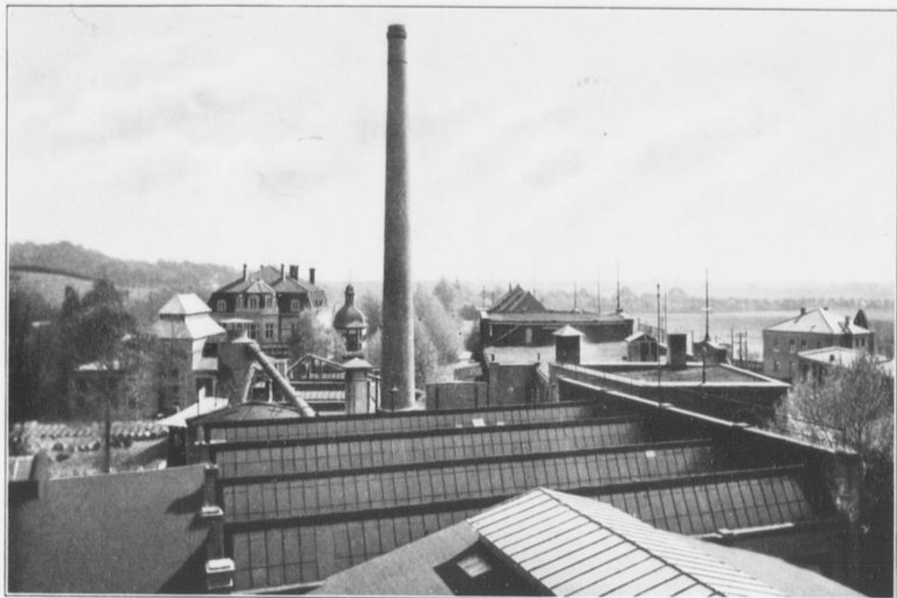
Teilansicht der Dachflächen der südlichen Gebäudegruppe.