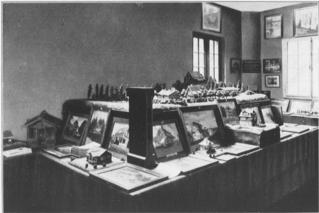
Modelle und Abbildungen von Holzhäusern und Siebel-Baracken.