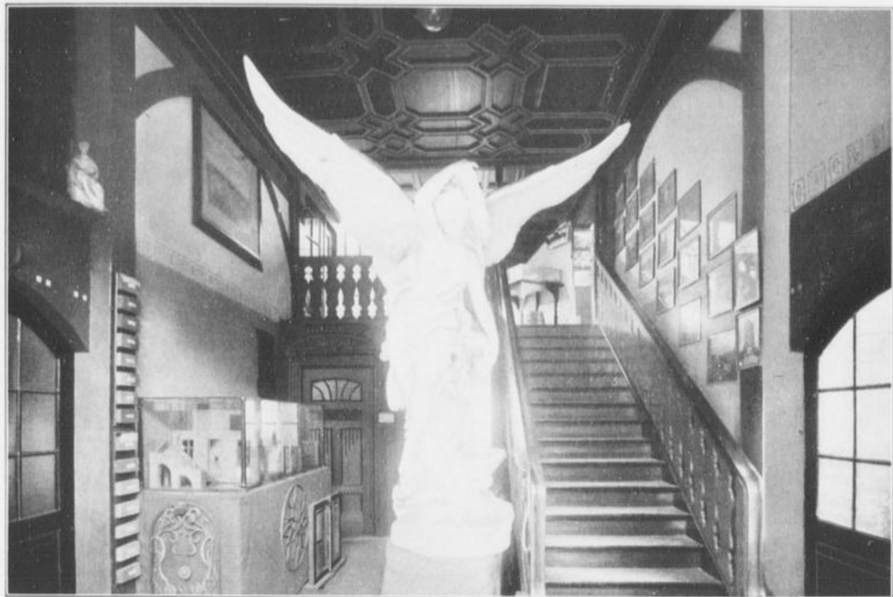
Ausstellung der Holzbearbeitungs-Fabrik und Kunstschlosserei.