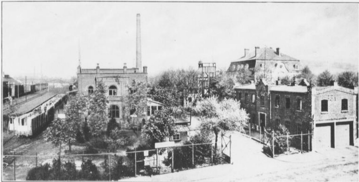
Haupteinfahrt zum Werk an der Bergstraße, Haltestelle Siebel (Zentrale) der elektrischen Straßenbahn, Linie 12.