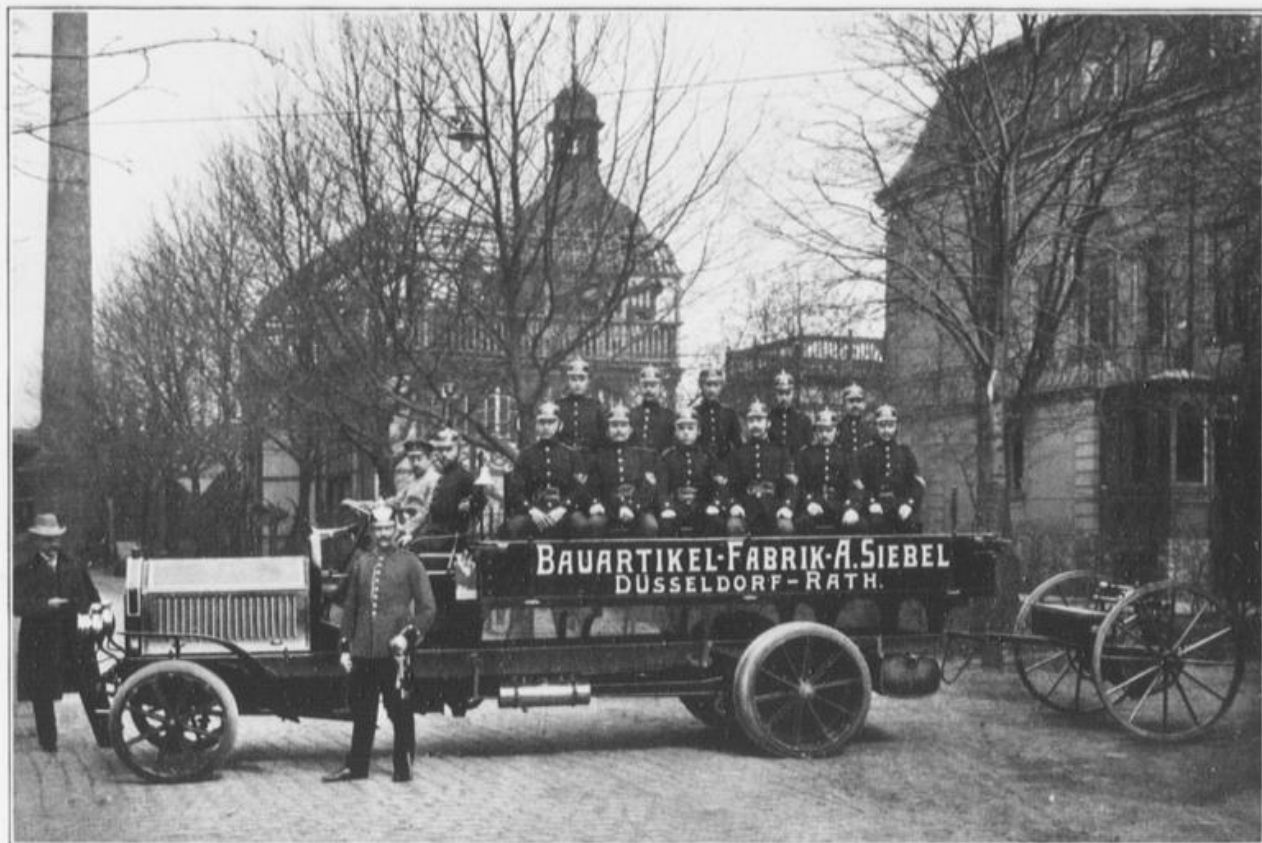
Fabrik-Feuerwehr fertig zum Ausrücken bei Bränden außerhalb des Werks.