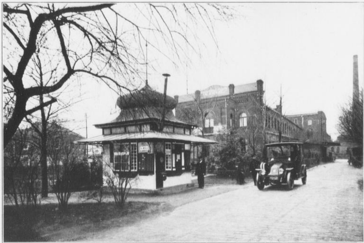
Pförtnerhaus mit Arbeiter-Kontroll-Apparaten.