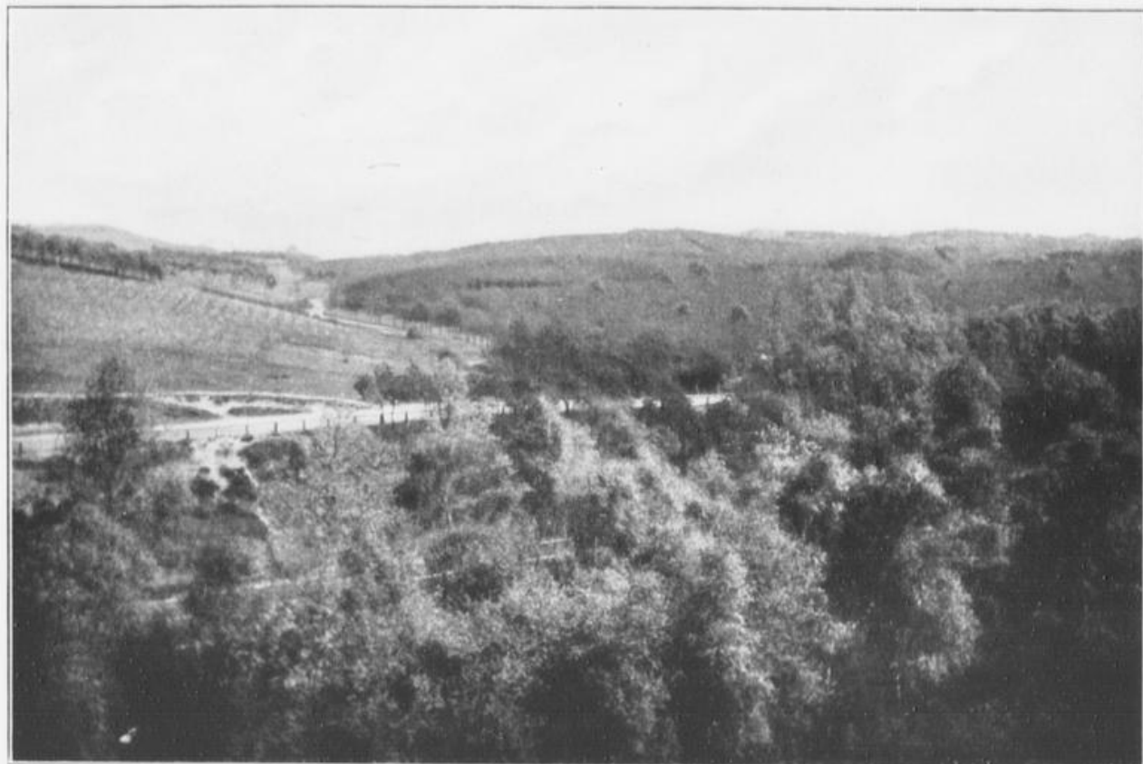
Zum Werk gehörige Parkanlage und Düsseldorfer Stadtwald.