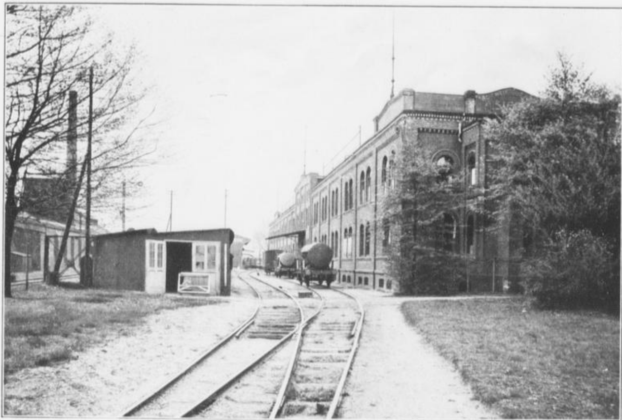
Hauptfabrikbau mit Staatsbahn-Anschluß.