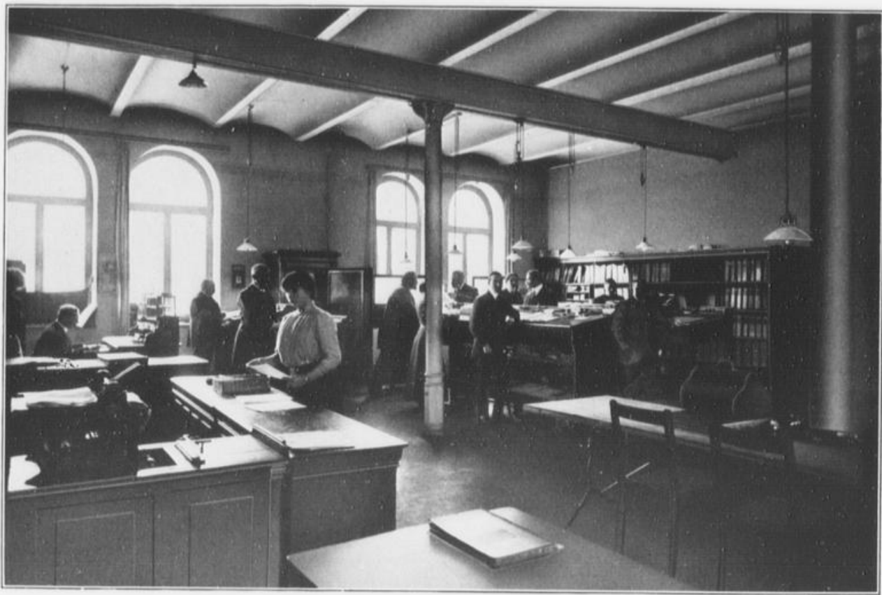
Teilansicht des Hauptkontors.