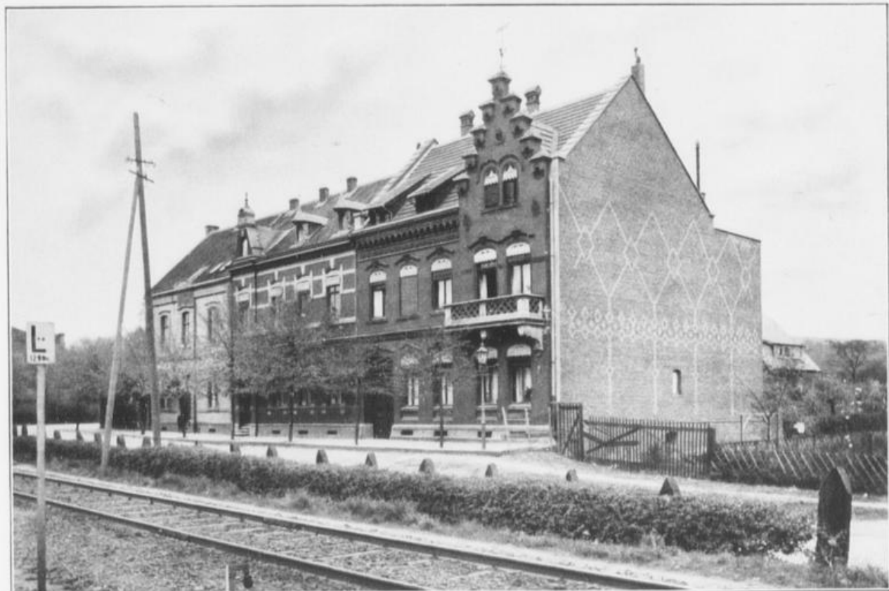
Werks-Wohnhäuser am Ratterbroich.