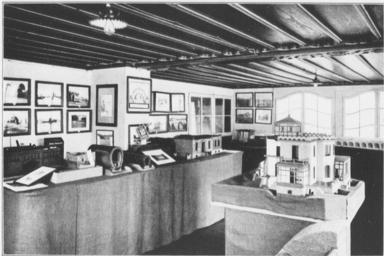
Modelle und Abbildungen von Bauwerken, die mit Siebels Blei-Isolierung abgedichtet wurden.