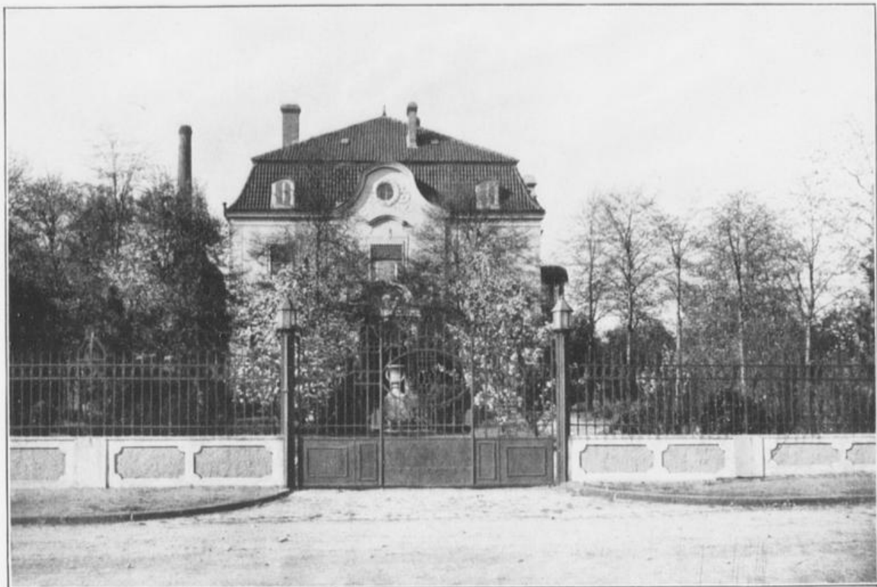
Haus Siebel an der Bergstraße.