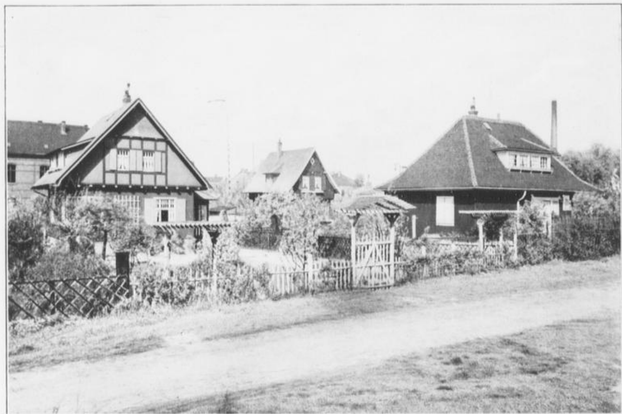
Siebelsche Holzhäuser an der Forststraße als Einfamilien-Wohnungen für Beamte des Werks.